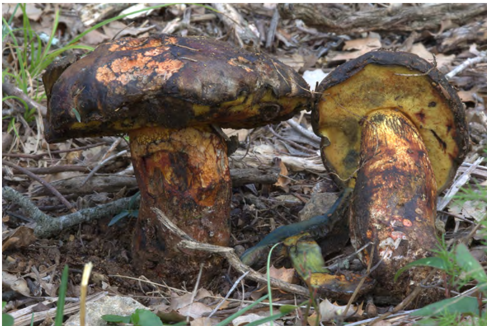
Boletus poikilochromus Pöder, Cetto & Zuccher

DESCRIPCIÓ. Boletus poikilochromus es caracteritza per ser una espècie de mida mitjana i d'aspecte sovint robust, amb el pileu de fins a 10-12 cm de diàmetre, hemisfèric o més o menys convex, amb la cutícula llisa i brillant en temps humit, però mat i una mica vellutada en assecat-se, de color molt variat i poc uniforme, des de l'ocre groguenc fins al bru olivaci o el bru vermellós, que es taca sovint de roig ataronjat o roig vinós fosc, i de blau fosc en manipular-lo; a les ferides, la carn pren una coloració ferruginosa pàl·lida. L'estípit és robust, de fins a 3-4 cm de diàmetre, més o menys claviforme o, fins i tot, ventrut, sovint amb la base lleugerament radicant; el seu color és també força variable, des del groguenc o el bru ataronjat fins el bru rogenc o ferruginós, sovint clapejat de diversos colors i tacat de blau fosc quan es manipula; té un reticle molt evident a la superfície, sobretot vers l'apex, format per malles amples de color primer groguenc, però progressivament bru rogenc o ferruginós en madurar.