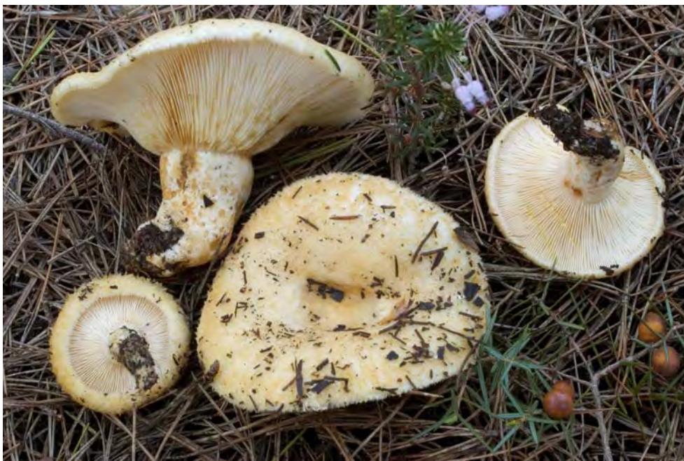
Lactarius pseudoscrobiculatus Basso, Neville & Poumarat

OBSERVACIONS. Espècie ja citada a l'illa per SIQUIER & CONSTANTINO (1995).