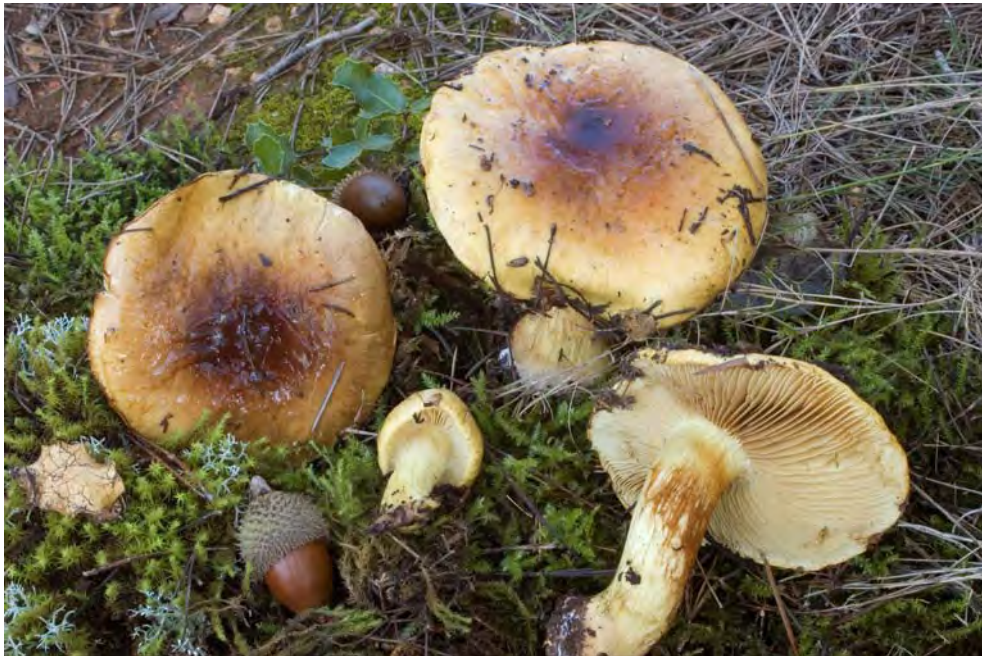
Cortinarius aurilicis Chevassut & Trescol