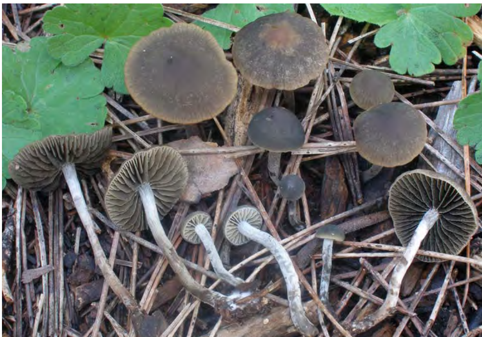
Panaeolus guttulatus Bres.