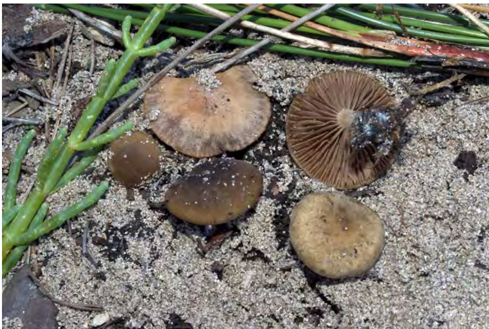
Simocybe centunculus var. maritima (Bon) Senn-Irlett