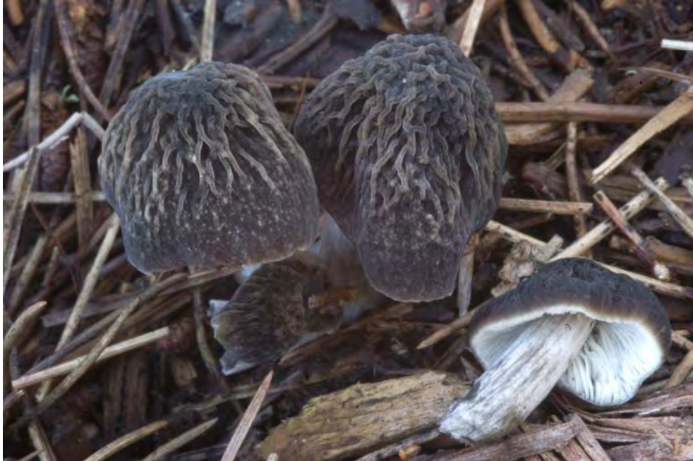
Pluteus thomsonii (Berk. & Broome) Dennis