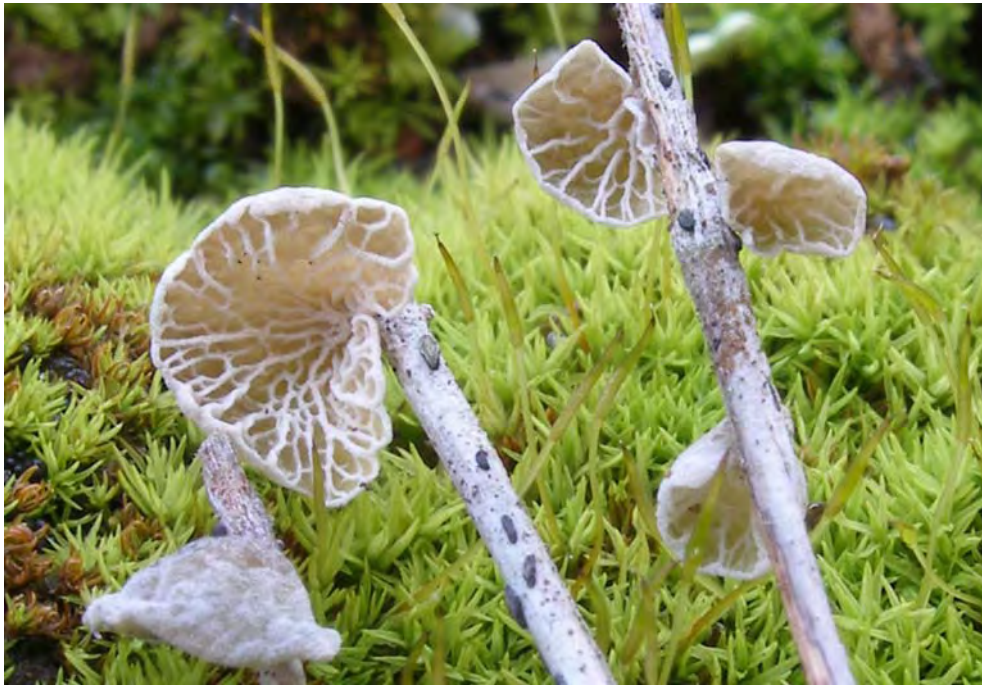
Campanella caesia Romagn.