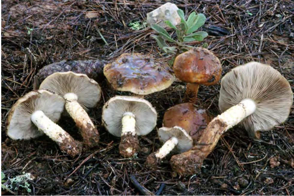
Pholiota brunnescens A.H. Sm & Hesler