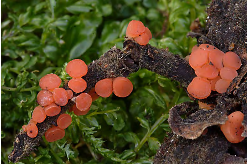
Komposcypha chudei (Pat. ex Le Gal) D.H. Pfister