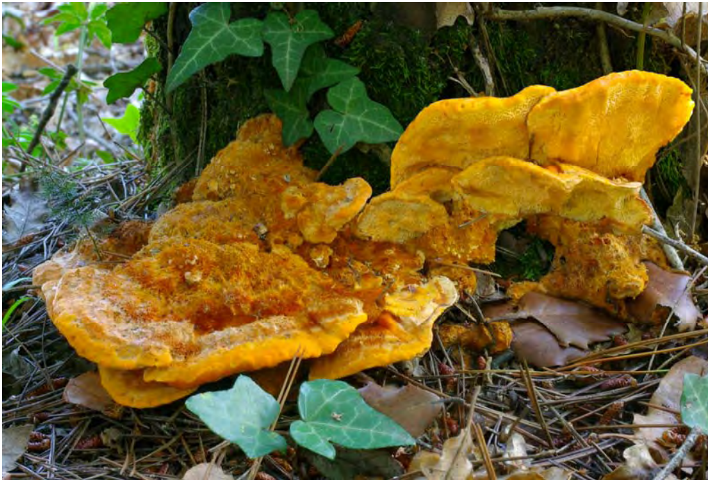
Pycnoporellus fulgens (Fr.) Donk