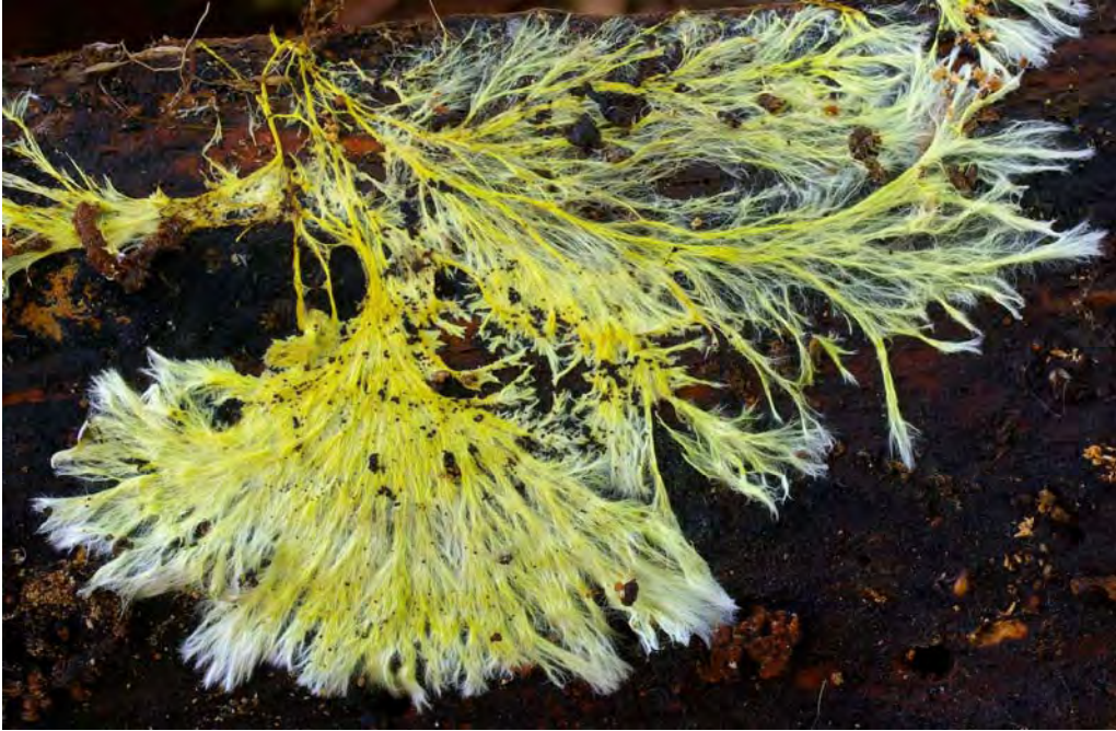
Xenasmatella vaga (Fr.) Stalpers