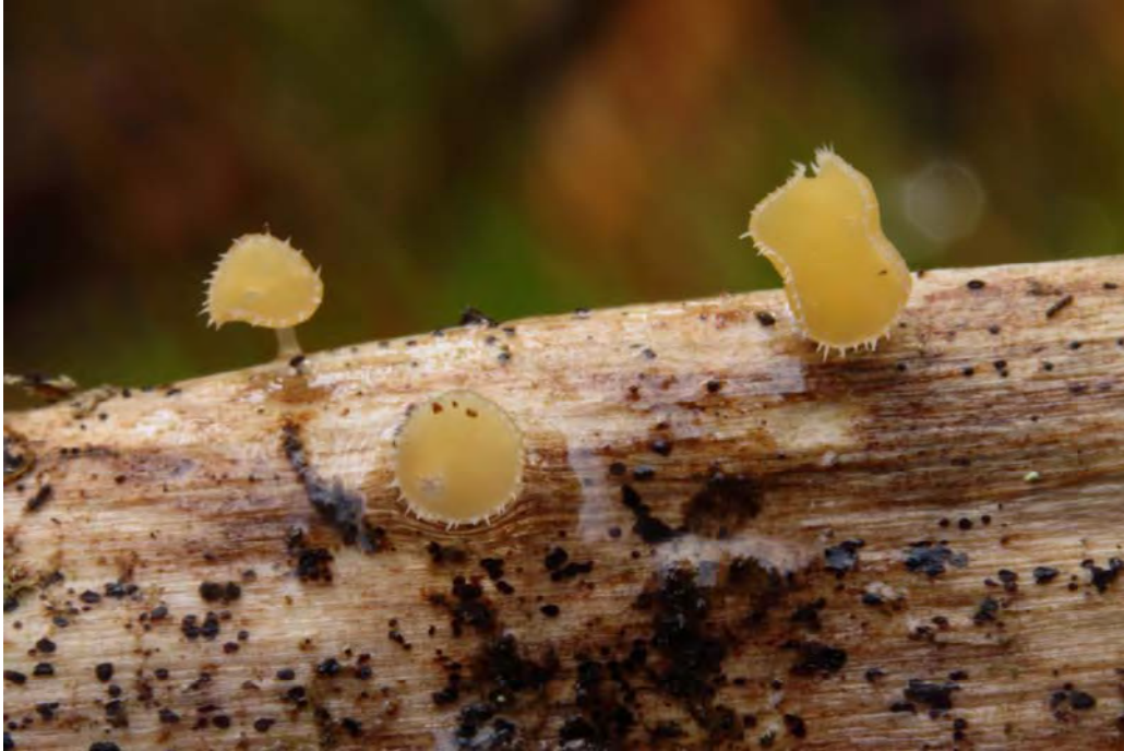
Crocicreas pallidum (Velen.) S.E. Carp.