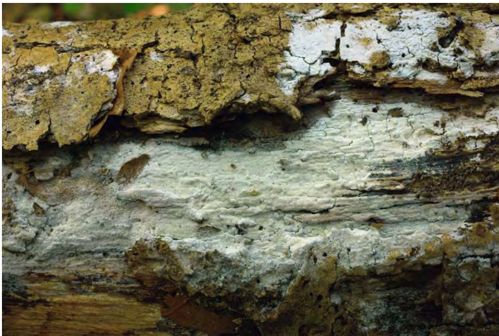
Subulicystidium longisporum (Pat.) Parmasto