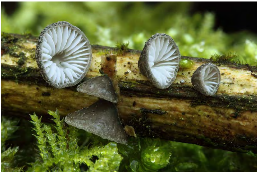
Hohenbuehelia cyphelliformis (Berk.) O.K. Mill.