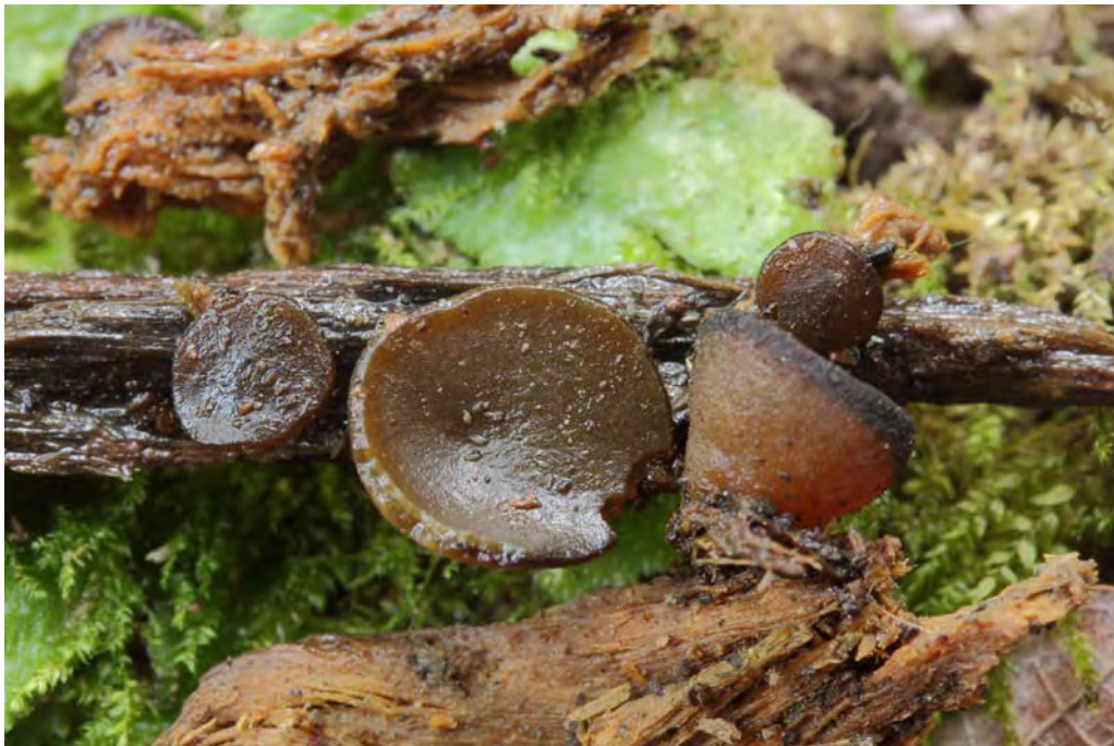
Peziza apiculata Cooke