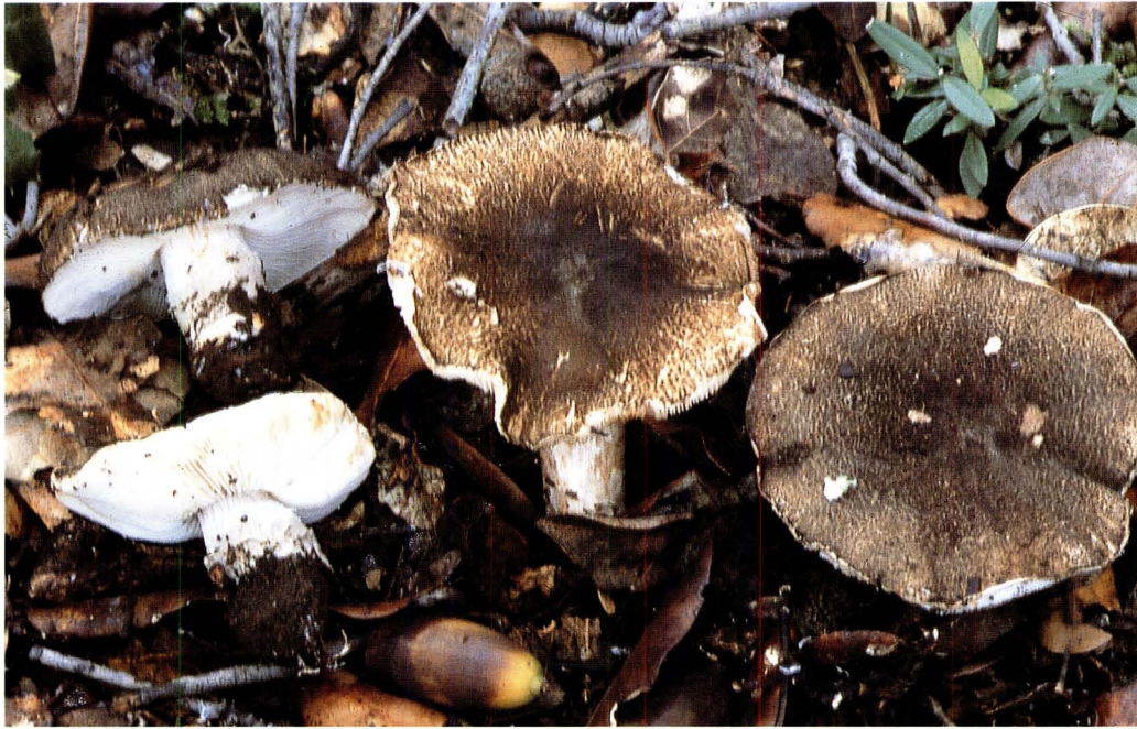
Lepiota andegavensis Mornand