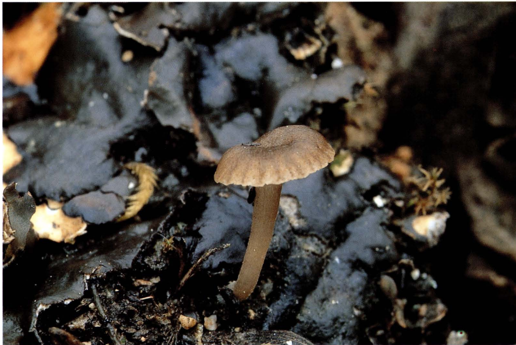
Omphalina peltigerina (Peck) P. Collin