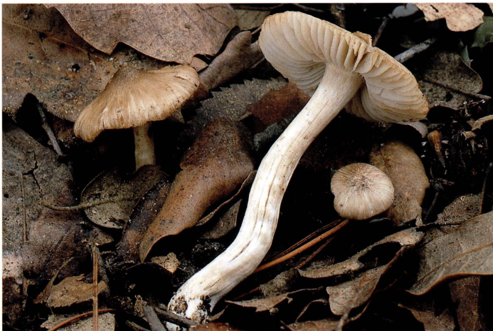
Hygrocybe fornicata (Fr.) Singer