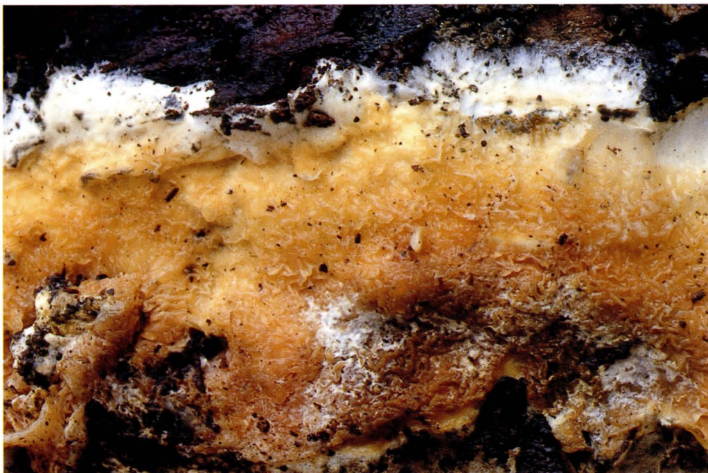
Serpula himantioides (Fr.: Fr.) Boud.