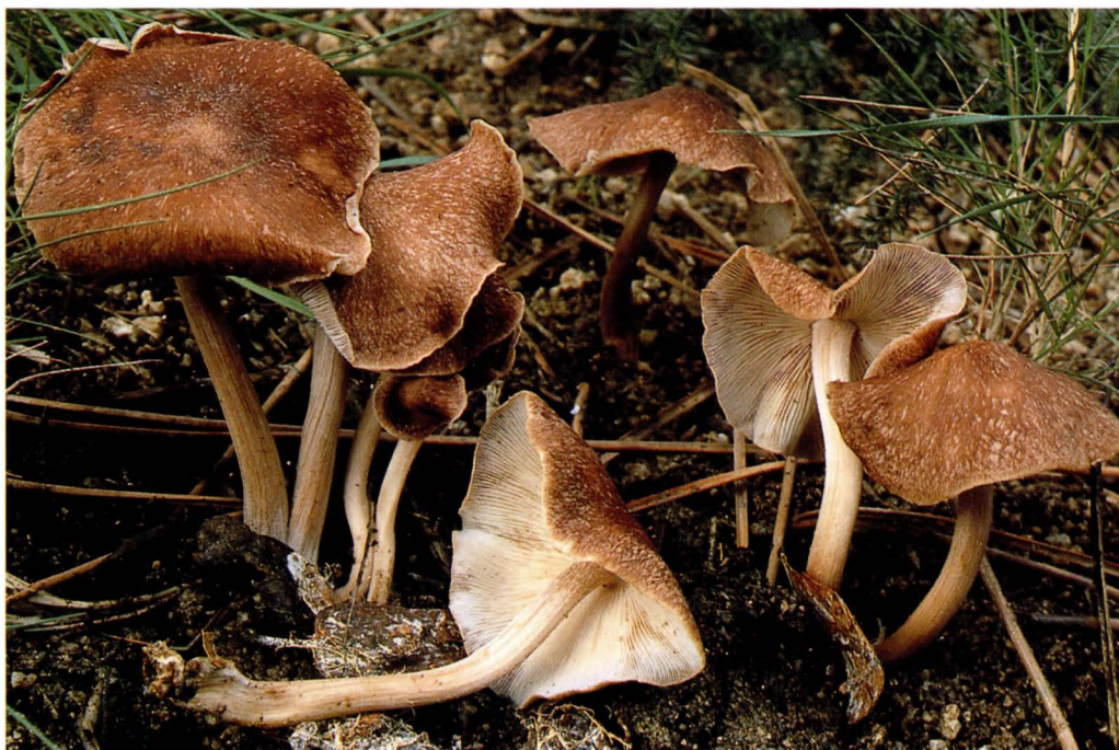
Collybia luxurians Peck