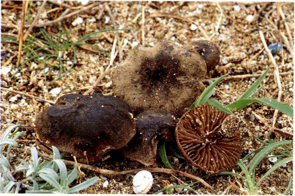
Entoloma undulatosporum Arnolds et Noordel.