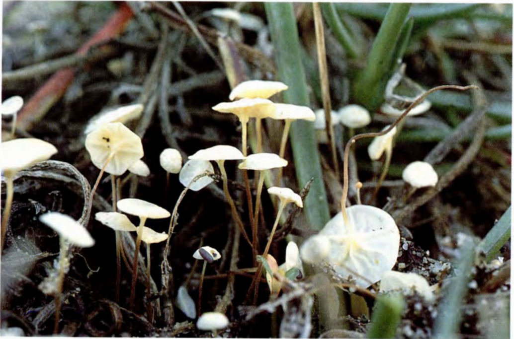
Marasmius epiphyllus (Pers.: Fr.) Fr. var. plantaginae Heim