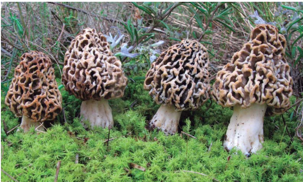
Morchella dunensis (Castañera, J.L. Alonso & G. Moreno) Clowez.