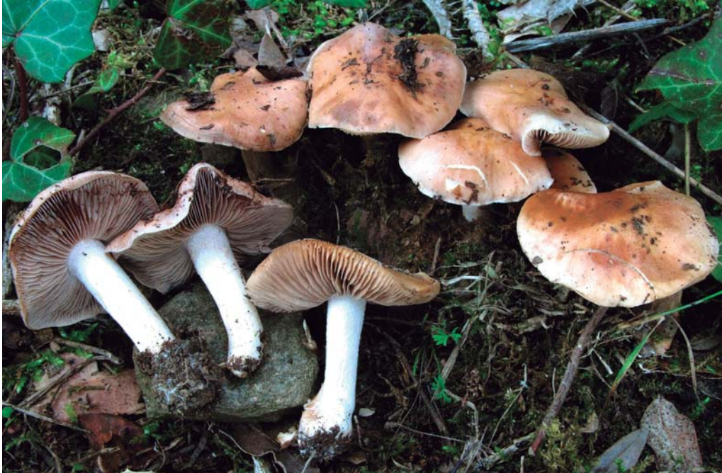
Hebeloma celatum Grilli, U. Eberh. & Beker.