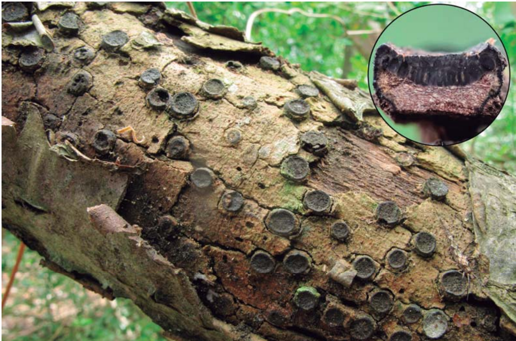
Biscogniauxia marginata (Fr.) Pouzar, amb detall de la secció transversal de la palissada de peritecis.