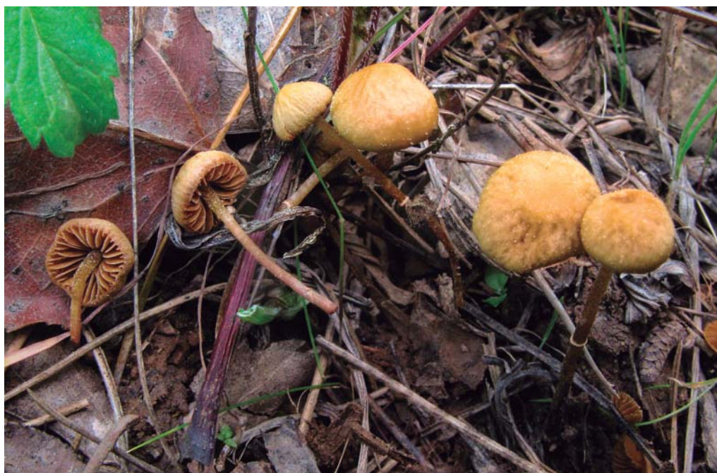
Pholiotina mediterranea Siquier & Salom.