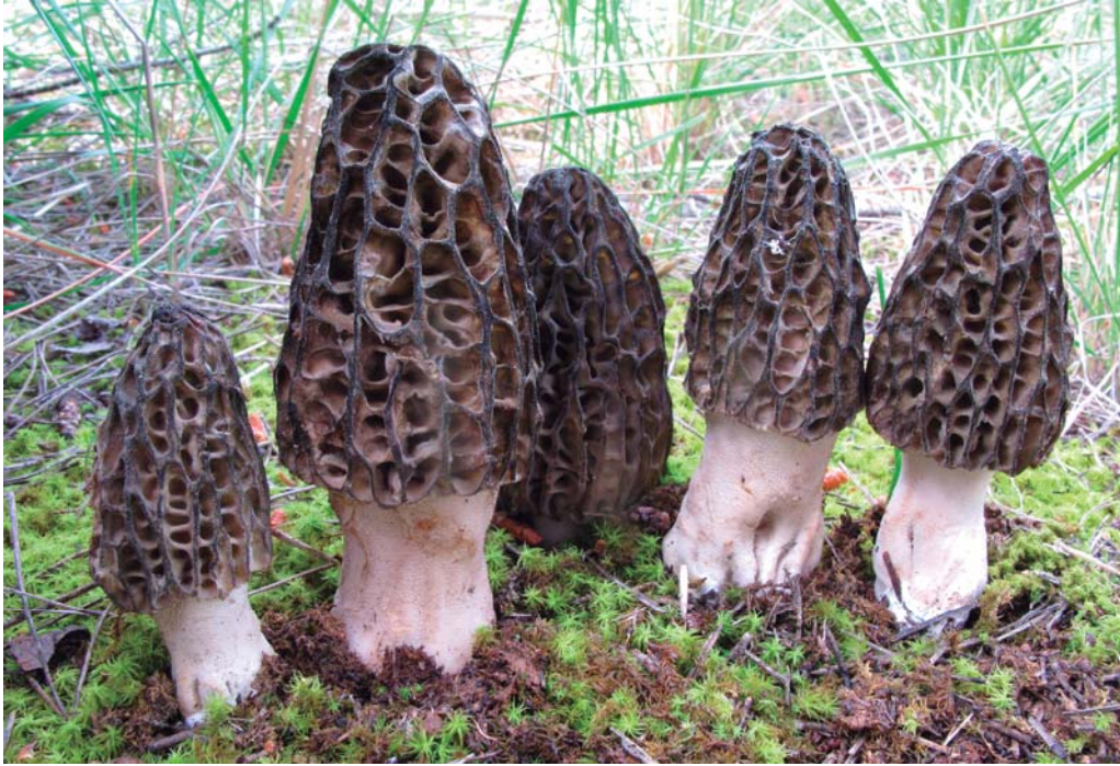
Morchella dunalii Boud.