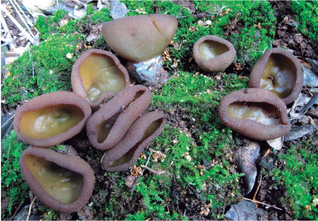
Peziza limnaea Maas Geest.

OBSERVACIONS. Segona citació a Catalunya.