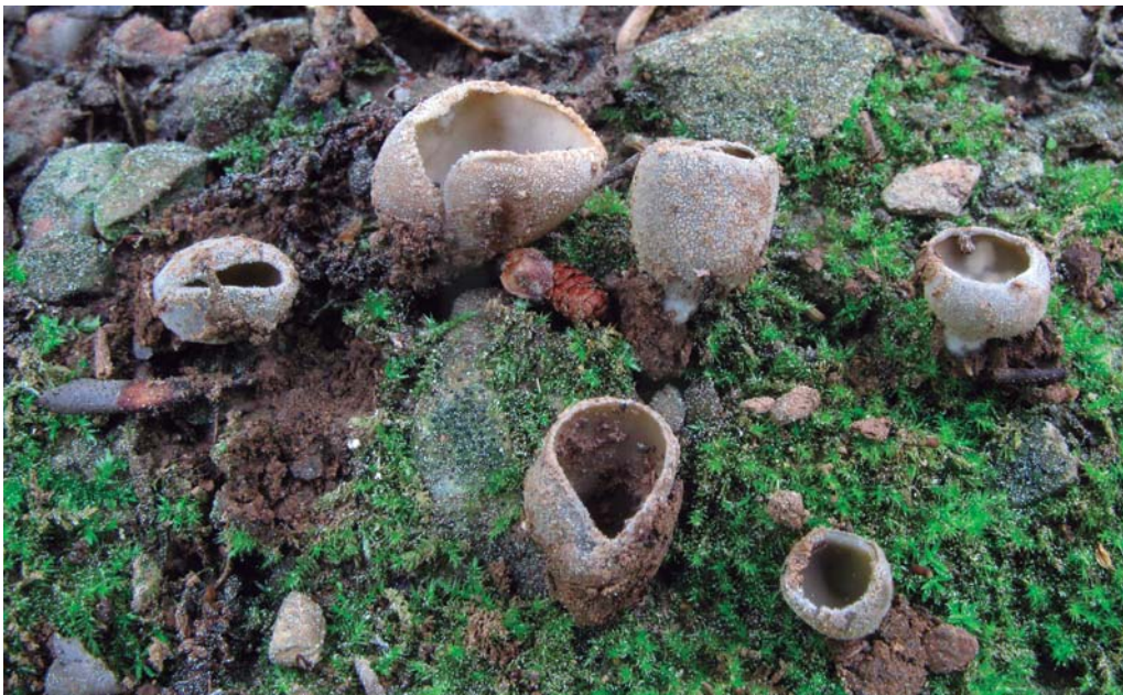
Tarzetta gaillardiana (Boud.) Korf & J.K. Rogers.