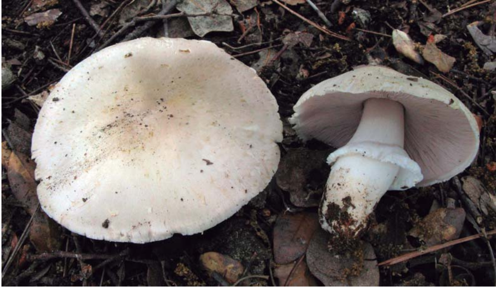
Agaricus indistinctus L.A. Parra & Kerrigan.