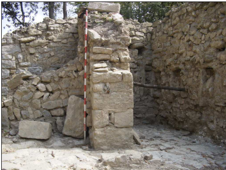
FIGURA 4. Detall de l'escala ja excavada amb el mur de suport i espitlleres al fons, sota l'escala

Per tant, els graons de l'escala es recolzen sobre terra directament i es construeix una paret, a la part oposada a la paret mestra del mateix edifici, com és el mur est. No hi ha forats a la paret est, que haurien fet de suport als esmentats graons.