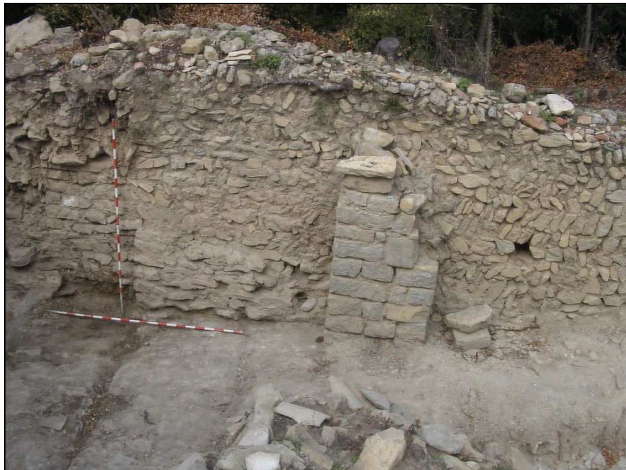
FIGURA 5. Mur nord construït amb opus spicatum. Pilar i restes d'una estructura anterior

L'extrem oposat s'observa un altre enderroc, però no s'ha pogut saber si és la mateixa paret destrossada o bé una obertura.