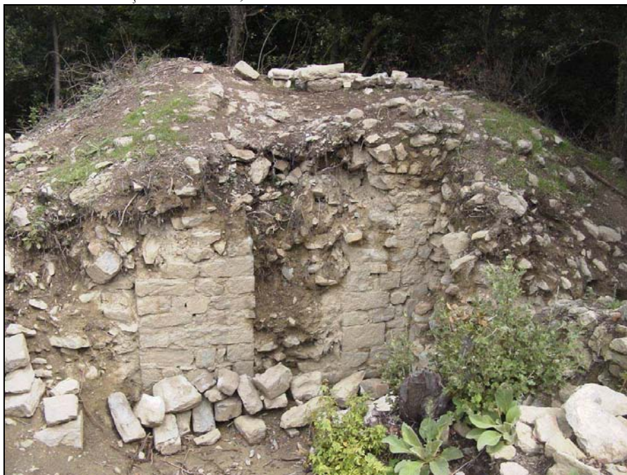
FIGURA 3. Façana de la torre, sense excavar

constructiu i una etapa posterior, segurament del segle XIII. Presenten una mateixa tipologia constructiva.