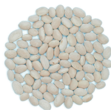
Castellfollit del Boix