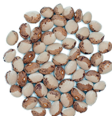
Genoll de Crist