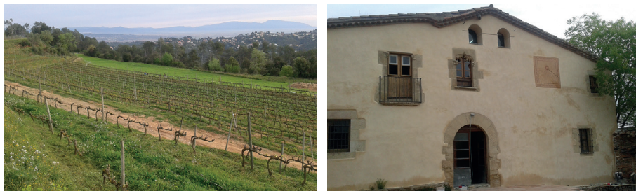
FIGURA 3. Can Calopa de Dalt, conreu de vinya a Collserola i masia del segle XVI