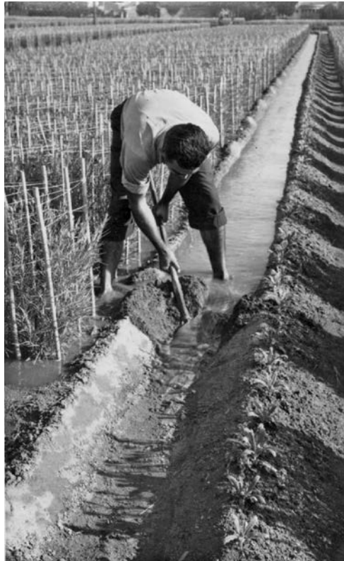
FIGURA 5. Reg a manta mitjançant solcs en una plantació de clavell. Juliol de 1956