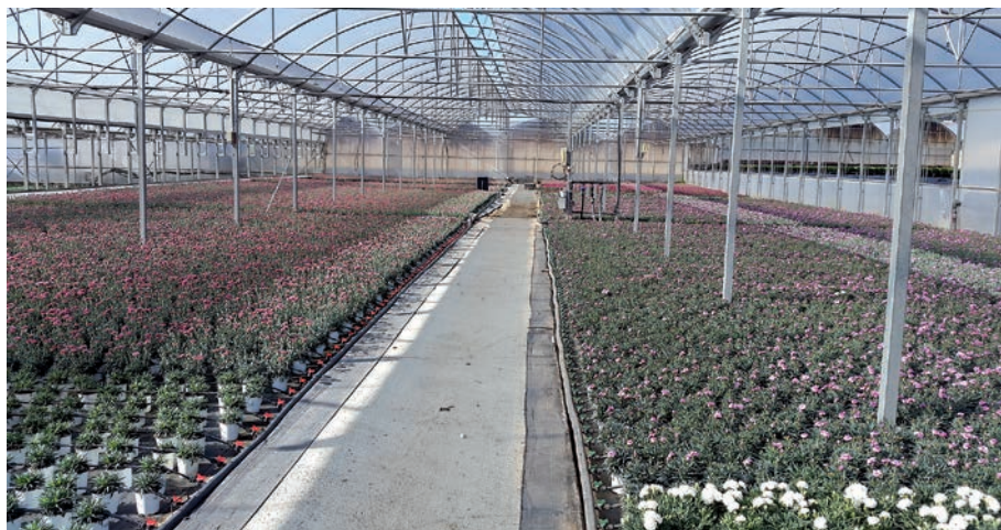
FIGURA 14. Hivernacle per a la producció de clavell de test. Any 2015

buïdors del sector 1 se sobrepassen el milió i mig de plantes a l'any i la tendència és continuar augmentant. També es pot afirmar que, aproximadament, un 70% del consum de clavell per a flor tallada d'Espanya, encara es distribueix des de Catalunya, que, en cada conjuntura, se subministra des dels diferents països de producció.