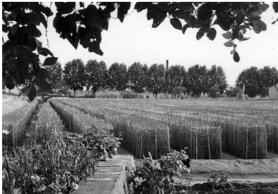
FIGURA 6. Camp de clavell italià a l'aire lliure (entre 1950 i 1960)