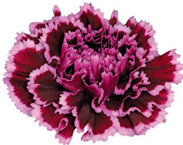
FIGURA 13. Varietat nobbio burghundy, de l'empresa Hybrida, Itàlia

Actualment, la producció al món està basada en el cultiu de varietats mediterrànies i mini. La tendència actual és aconseguir varietats amb més productivitat i precocitat i amb una gran gamma de colors fantasia (figura 13). Això s'aconsegueix amb encreuaments de Dianthus barbatus amb cultivars mediterrànies. També s'obtenen varietats amb noves formes, algunes de ben curioses, perquè tenen forma i color com si es tractés d'un verd d'acompanyament floral. Els principals productors mundials són Colòmbia, Kènia i el Japó, però també comença a haver-hi plantacions a l'Iran, el Marroc, Armènia, Tunísia, l'Índia, etc. En l'àmbit de l'Estat, la producció més important es concentra a Cadis i Múrcia.