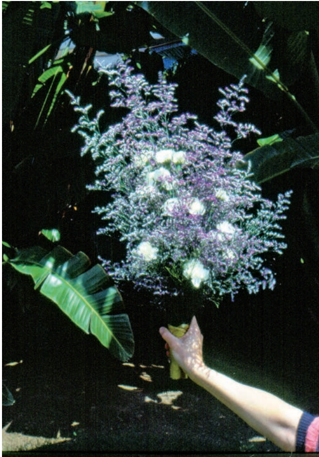
FIGURA 12. Ram per als guanyadors dels Jocs Olímpics de Barcelona 1992, elaborat amb limònim i clavell

des els comença a treballar l'equip de protecció vegetal de l'IRTA i s'apliquen a través de les agrupacions de defensa vegetal (ADV) i d'altres formes de transferència.