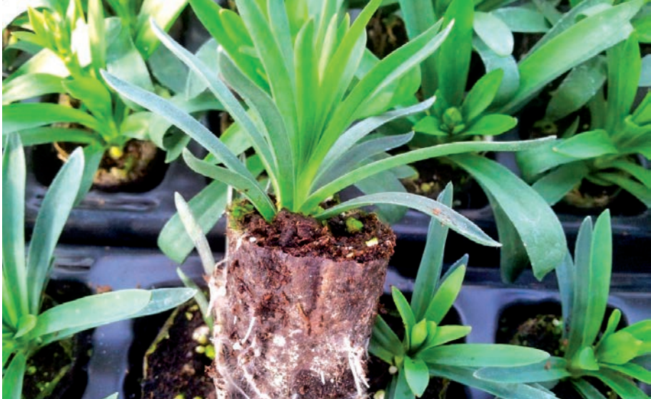
FIGURA 9. Esqueixos comercials arrelats. Any 2015