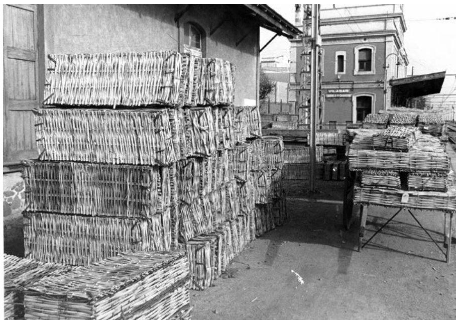
FIGURA 2. Paneres per a transportar els clavells, estació de Vilassar de Mar. Anys 1950