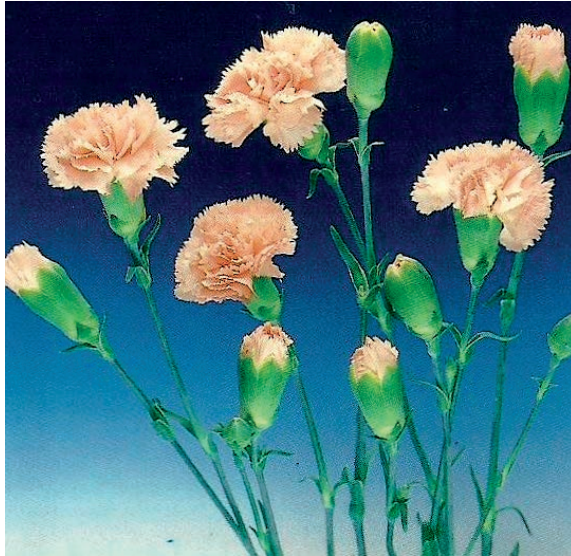
FIGURA 11. Tiges florals de clavell miniatura o spray