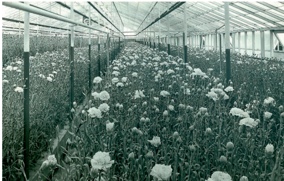
FIGURA 8. Varietat sim de clavell en hivernacle. Juliol de 1958