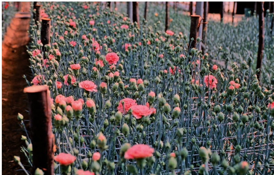
FIGURA 10. Grup de cultivar estàndard mediterrània. Any 1995