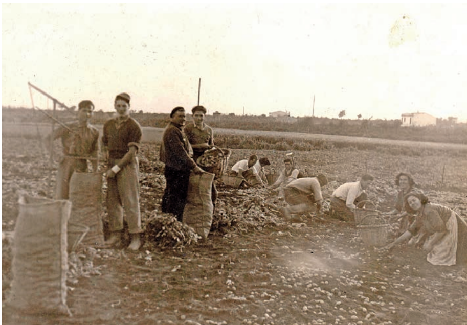
FIGURA 1. Recol·lectant i pesant patata tendra a Can Vila. Any 1946