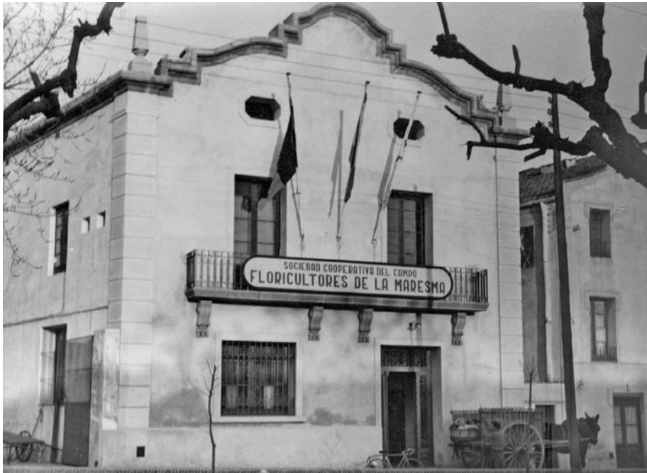
FIGURA 3. Cooperativa Florimar, Vilassar de Mar. Anys 1950