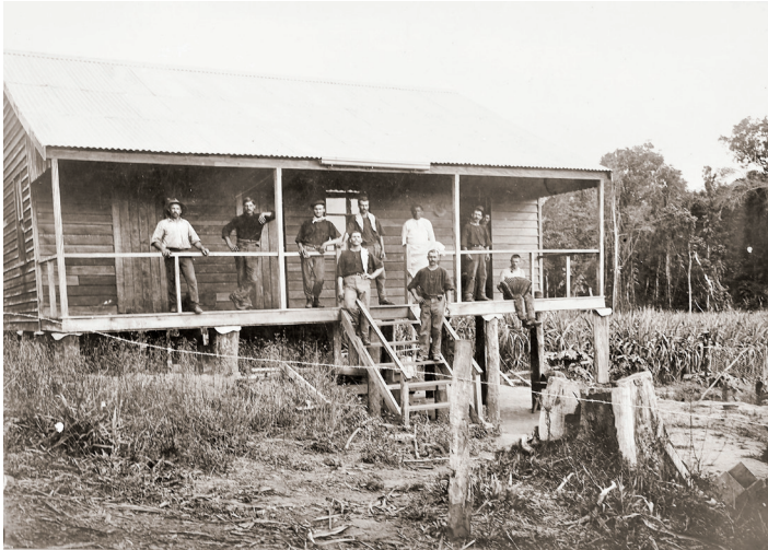
FIGURA 4. La casa a la finca agrícola de Bendigo amb treballadors