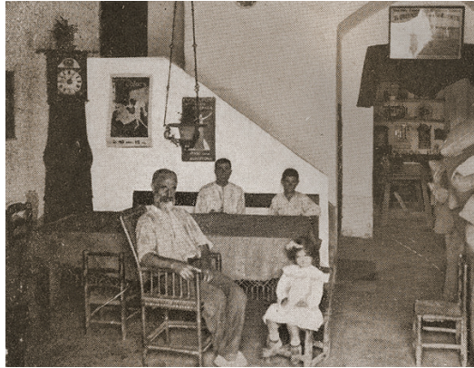
FIGURA 7. Menjador del Mas Germinal amb els fills i un treballador. Any 1909