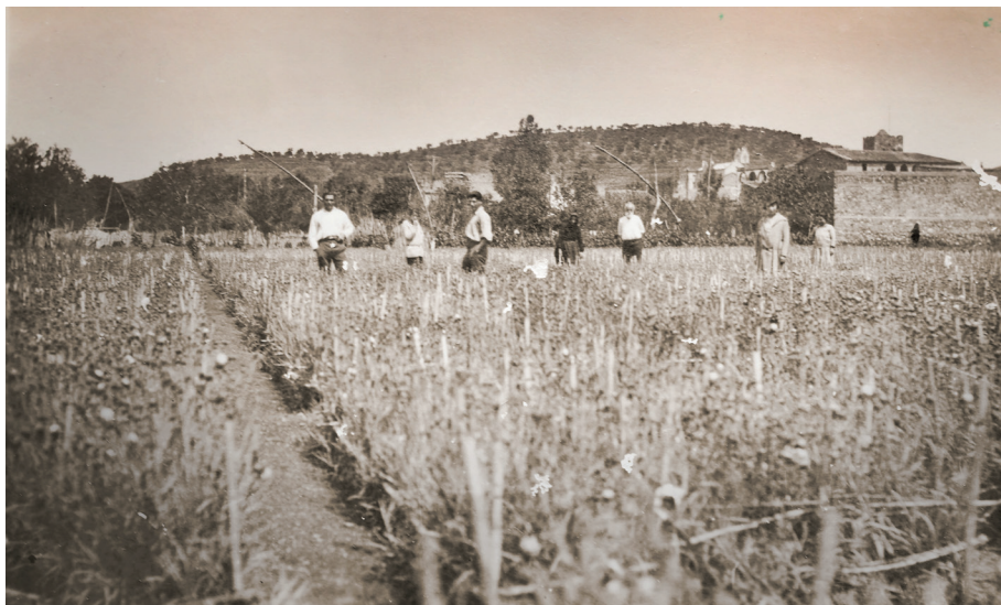
FIGURA 9. Extens camp de clavells de la família Ferrer a Llançà. Anys vint