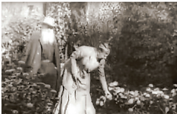
FIGURA 11. Lleó Tolstoi i la seva esposa Sofia al jardí que cultivaven de Yásnaia Poliana (Rússia). Anys 1900