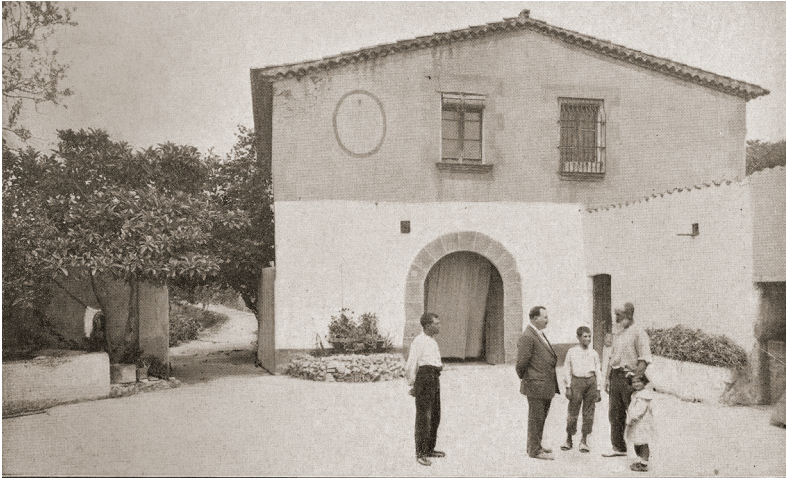
FIGURA 5. Mas Germinal, a Montgat