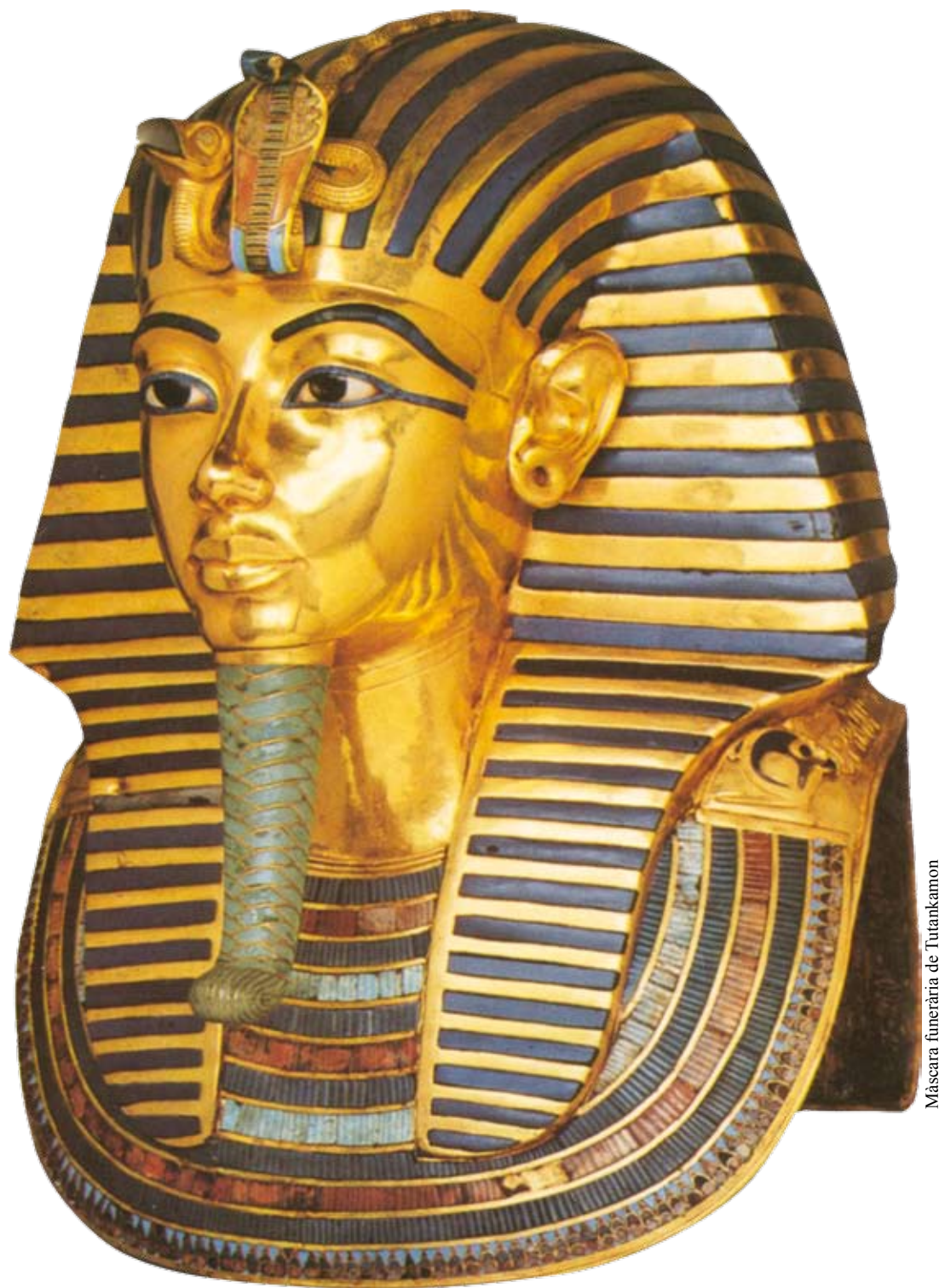
Màscara funerària de Tutankamon

peleòlegs d'Arkansas i de Veneçuela. Què tenien en comú tots aquests casos de pneumònia, inclosos els relacionats amb la famosa maledicció de Tutankamon? Era evident, però ningú no hi havia caigut: piles d'excrements de ratpenats.