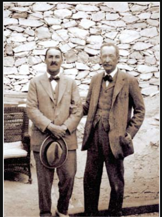
Howard Carter (esquerra) i Lord Carnarvon fotografiats el 18 de Febrer del 1923.

George E.S.M. Herbert, comte de Carnarvon, morí de manera inexplicable el 6 d'abril de 1923 al Caire. Presentava un estrany quadre de fatiga, amb mal de cap, insuficiència respiratòria i adenopaties diverses d'ençà que una sobtada pneumònia bilateral l'obligà a abandonar l'excavació de la tomba de Tutankamon, pocs dies després d'aquell emocionant 17 de febrer de 1923, data en què fou desclosa la intacta cambra mortuòria del faraó. Altres personatges que participaren en l'obertura de la tomba també moriren poc després, afectats de malalties no aclarides. Inevitablement es consolidà la creença que havien estat víctimes d'una venjança d'ultratomba: com explicar, sinó, semblant coincidència?