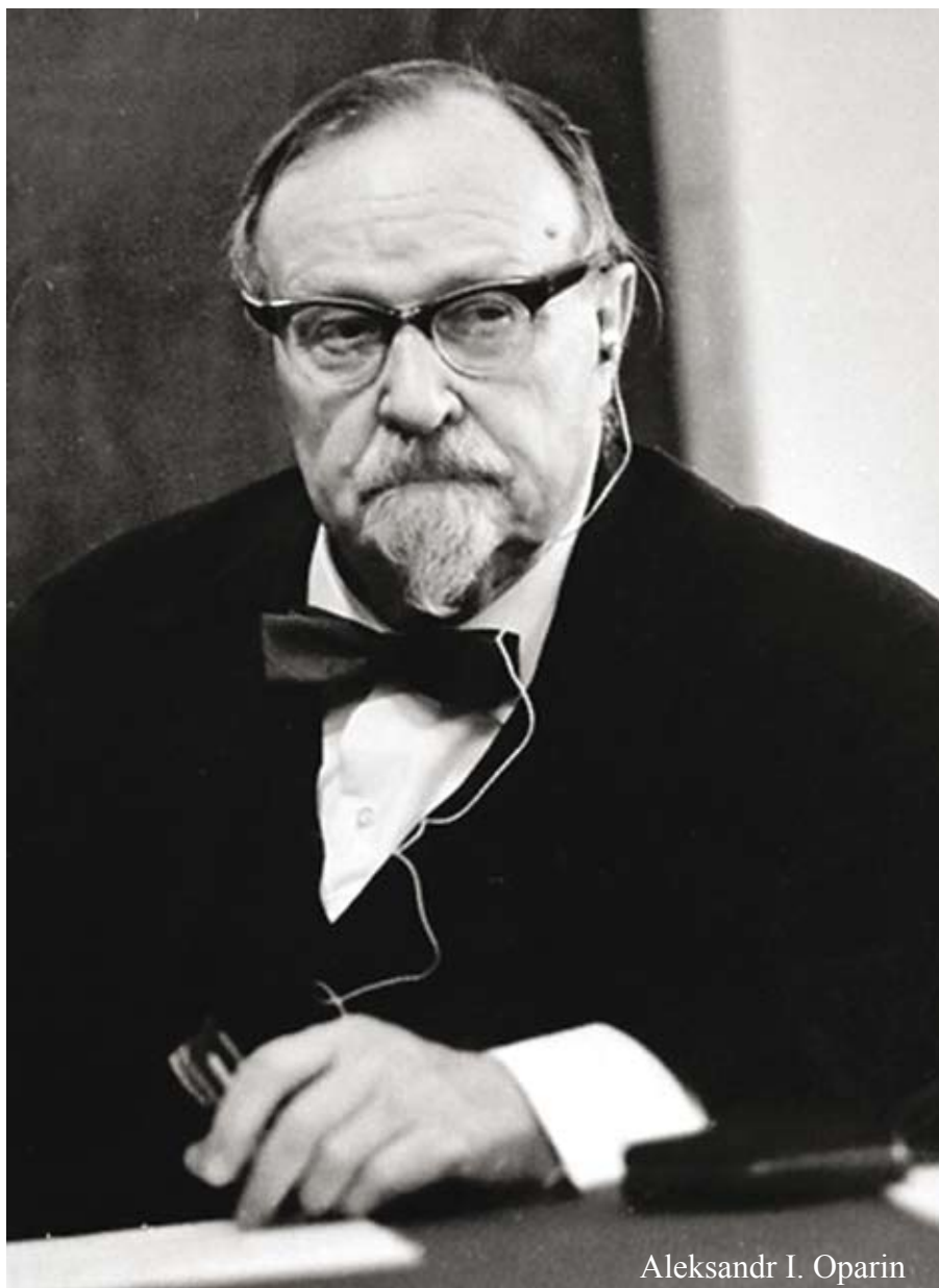
Aleksandr I. Oparin

hipòtesis que retrospectivament ens poden semblar inversemblants o absurdes. Així, el químic suec Svante Arrhenius va invocar l'eternitat de la vida a l'univers i la possibilitat de la transferència d'espores entre planetes o panspèrnia . Per a Haeckel o per a Thomas H. Huxley, amic i màxim defensor públic de Darwin, la vida hauria aparegut espontàniament a partir d'aglomeracions amorfes de protoplasma —la «base física