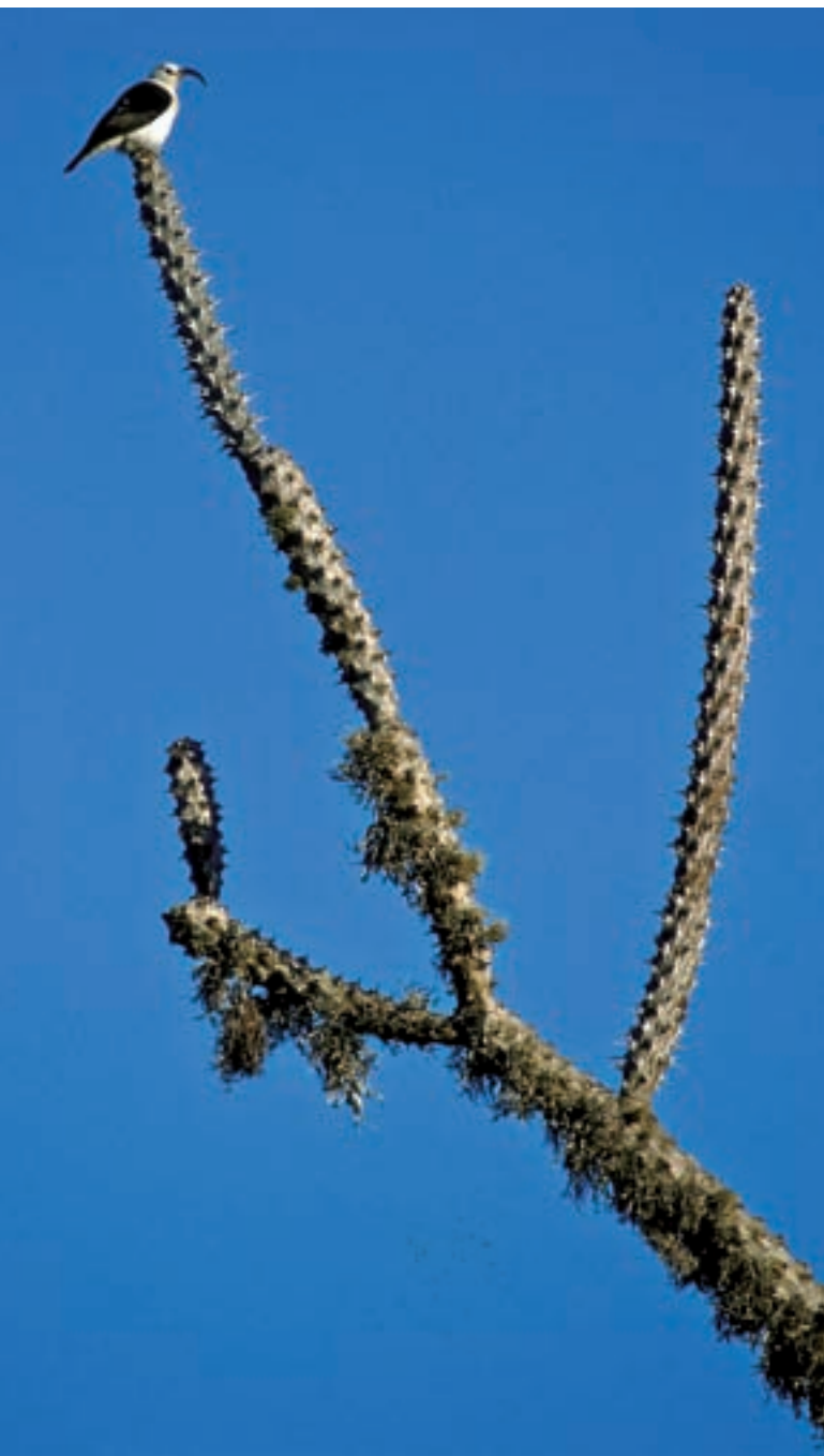
A dalt del tot d'un arbre pop (pertanyent a les didiereàcies, una família totalment endèmica de Madagascar), un vanga de bec corbat ( Falcullea palliata ) ataülla l'horitzó d'Ifaty.

«LA INSULARITAT I EL PERLLONGAT AÏLLAMENT HAN FET DE MADAGASCAR UN FANTÀSTIC I GEGANTÍ LABORATORI DE L'EVOLUCIÓ QUE NO DEIXA DE SORPRENDRE LA COMUNITAT CIENTÍFICA»