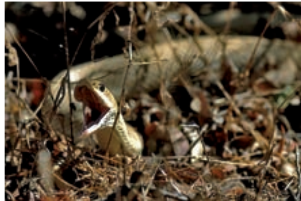
També hi ha quelonis singulars, com aquesta tortuga radiada ( Geochelone radiata ) (esquerra), i serps, com Leioheterodon modestus (dreta), ambdós rèptils fotografiats a la reserva especial de Beza-Mahafaly.