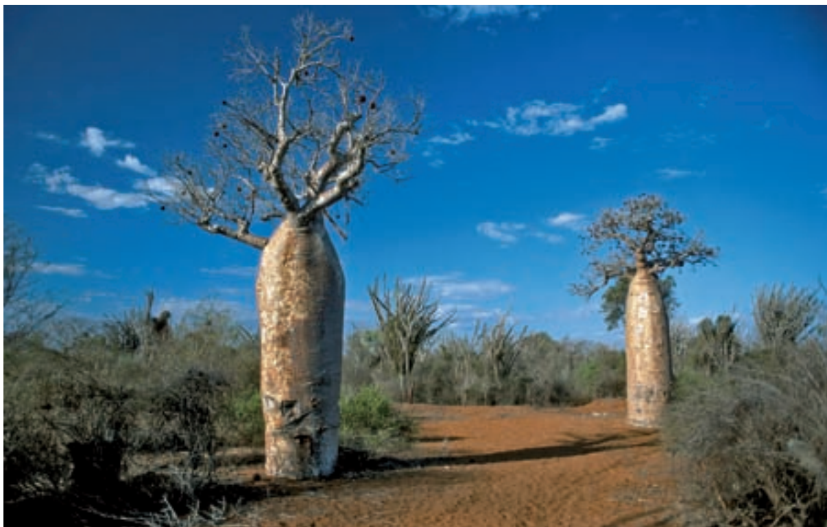
Adansonia fony (exemplars fotografiats a Ifaty), una de les set espècies de baobabs que creixen a l'illa. Això contrasta amb el fet que en tot el continent africà només hi viu una espècie de baobab.

dància de plantes suculentas, com ara eufòrbies i àloes, gairebé totes endèmiques, així com en els espectaculars baobabs ( Adansonia sp.), dels quals hi ha set espècies a l'illa (en tot el continent africà només n'hi creix una). Però també hi ha una clara relació amb la flora asiàtica. Per exemple, a Madagascar hi ha 175 espècies de palmeres (família Palmae o Aracaceae ) –a tot Àfrica n'hi ha menys de 60–, la immensa majoria de les quals (el 98%) són, també, endèmiques i curiosament tenen més afinitats amb les espècies asiàtiques. Una cosa semblant passa amb les orquídiades, amb més de mil espècies presents a la gran illa, altre cop més que a tot el continent africà.