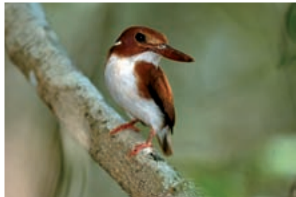
El grau d'endemisme també és molt alt entre els ocells. A l'esquerra, una mena de cucut d'allà –anomenat cua corredor ( Coua cursor )– ens observa entre els arbusts d'Ifaty. A la dreta, el blauet pigmeu malgaix – Ispidina (= Ceyx ) madagascariensis – a la reserva natural d'Ankarafantsika (Ampijoroa); és una de les dues úniques espècies de blauets de l'illa.

distribució extremadament disjunta. En canvi, sorprèn que no hi hagi agames, llangardaixos molt comuns a la propera Àfrica; ni tampoc cap serp verinosa. Sobta igualment l'absència de felins i cànids salvatges; la fosa ( Cryptoprocta ferox ), que a molta gent li sembla un felí, és en realitat un vivèrrid de la mida d'un gat gran, i és el major depredador de l'illa, deixant a part l'amenaçat cocodril del Nil. No hi ha tampoc cap ungulat nadiu; tres espècies d'hipopòtams que ho eren es van extingir probablement a causa de la caça. Actualment hi ha senglars africans ( Potamochoerus larvatus ) salvatges, però provenen d'animals introduïts. Entre els amfibis, són absents els gripaus, les salamandres i els tritons, fet compensat per les prop de 300 espècies de granotes, amb un extraordinari 99% d'endemicitat.