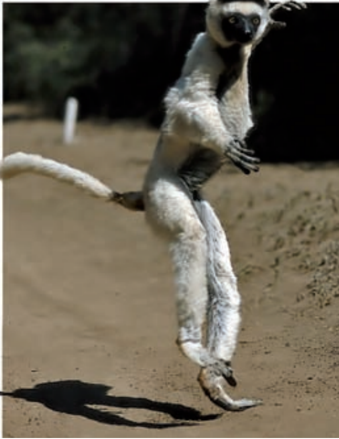
Els sifakes són populars pel seu simpàtic aspecte humà i, malgrat ésser essencialment arborícoles, pel fet de desplaçar-se per terra amb còmics salts de costat. En les fotos (a dalt i a sota), el sifaka de Verreaux ( Propithecus verreauxi verreauxi ), fotografiat a Kaleta Park (Amboasary Sud).