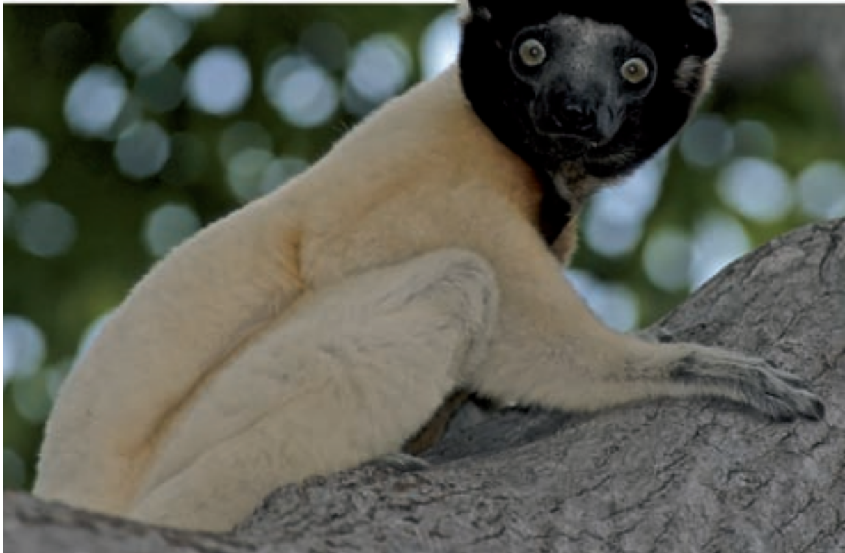
Un sifaka coronat ( Propithecus verreauxi coronatus ), també elevat a espècie pels primatòlegs, és un dels més amenaçats de tota la família. Fotografiat a Katsepy, ens observa atentament i sembla preguntar-nos si el seu món té futur.

forma d'aigua de pluja s'enduu el sòl fèrtil cap als rius, carregant-los de sediments i convertint-los en artèries vermelloses per on sembla que l'illa realment s'estigui dessagnant... potser és el que està passant.