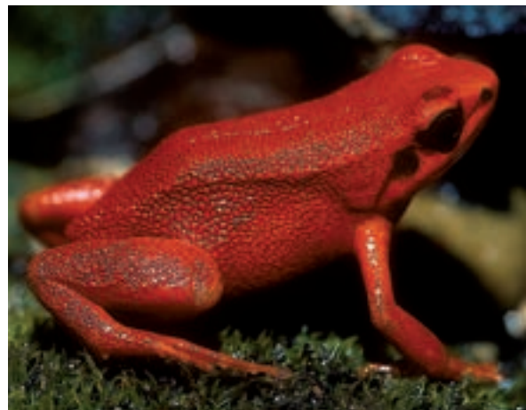
Aquí veiem l'espectacular Mantella aurantiaca , tan aposemàtica com minúscula: fa poc més de 2 cm.