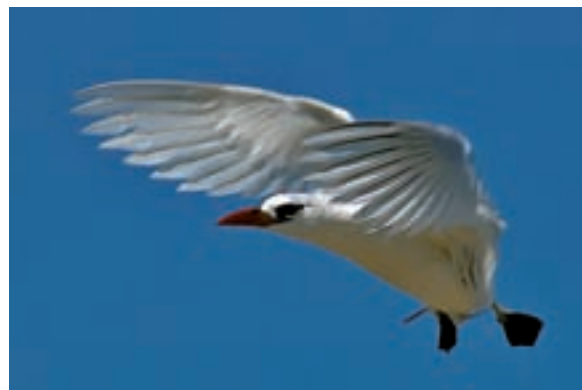
Un faetó cua vermell ( Phaethon rubricauda ) a punt d'aterrar a l'illa de Nosy Ve.

«LA INSULARITAT I EL PERLLONGAT AÏLLAMENT HAN FET DE MADAGASCAR UN FANTÀSTIC I GEGANTÍ LABORATORI DE L'EVOLUCIÓ QUE NO DEIXA DE SORPRENDRE LA COMUNITAT CIENTÍFICA»