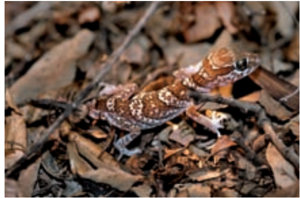
Entre els rèptils, destaquen els llangardaixos, com aquest Zonosaurus quadrilineatus (esquerra) que s'amaga sota la sorra; o Paroedura pictus (dreta), trobat a la reserva especial de Beza-Mahafaly, a qui no li cal soterrar-se, ja que es camufla perfectament entre la fullaraca del sòl.