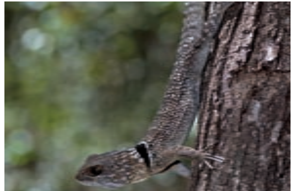
Altres rèptils es camuflen millor als arbres seguint la tonalitat de les branques, les fulles o els troncs, com el verdós Phelsuma madagascariensis , a la reserva especial d'Ankarana (esquerra), o la grisena iguana Oplurus cuvieri , a la reserva natural d'Ankarafantsika (Ampijoroa).