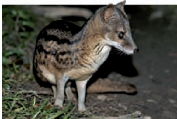
A Madagascar no hi ha ni felins ni canids salvatges, però sí altres carnívors, com la fanaloka ( Fossa fossana ), una mena de civeta endèmica (parc natural de Ranomafana).