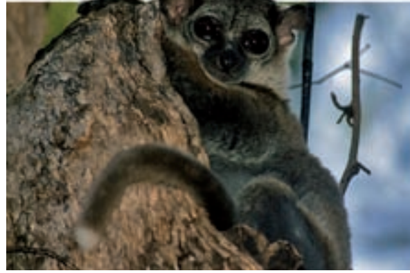
Lemúria és un altre nom que ha rebut aquesta illa-continent, degut a la preponderància de nombroses espècies d'aquest grup de primats que no viu enlloc més. En la imatge superior i inferior, el curiós lèmur de Milne-Edward ( Lepilemur edwardsi ), captat a Ampijoroa (reserva especial d'Ankarana), observa el fotògraf des del seu refugi a l'arbre.