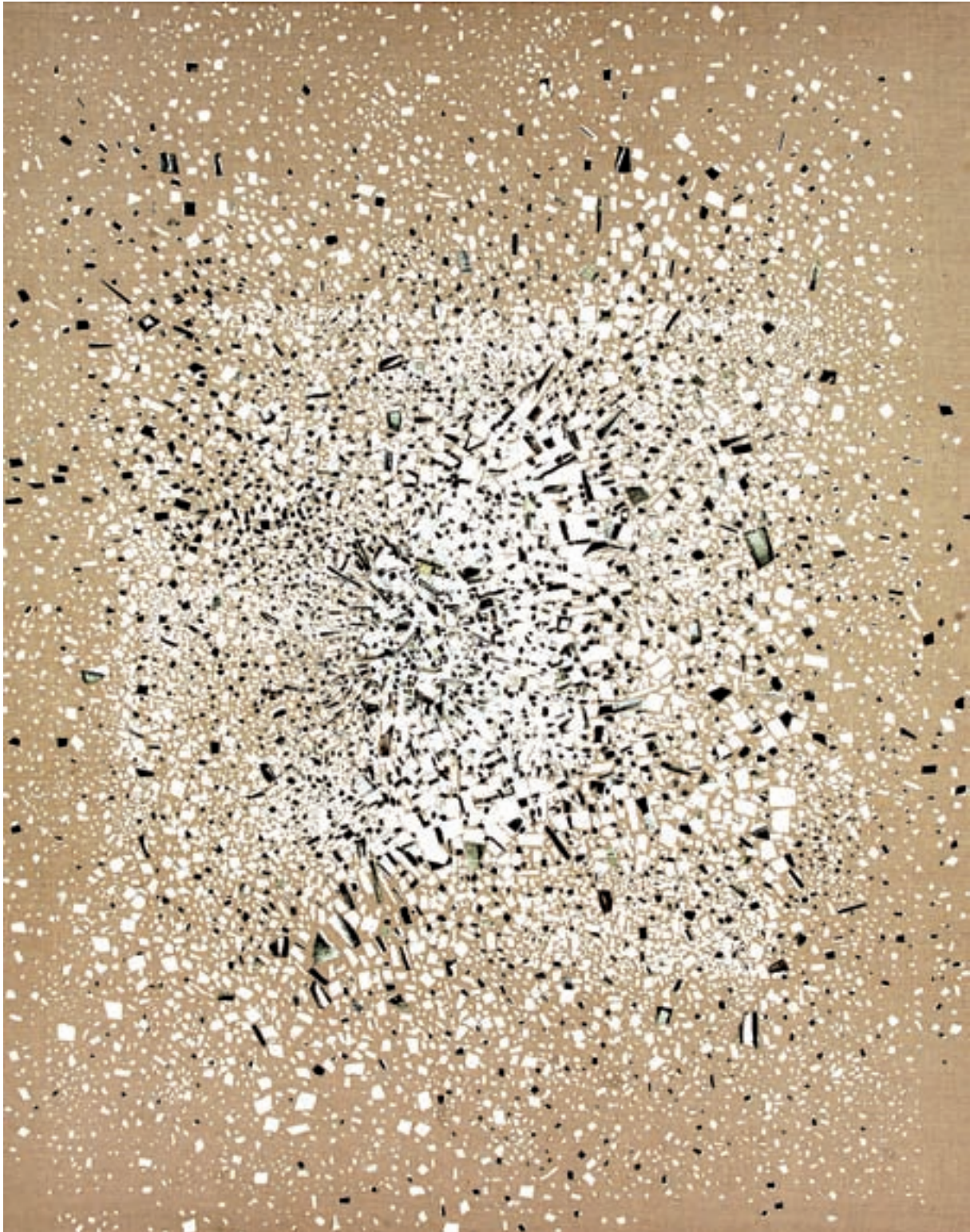
Fuencisla Francés. Obertura , 2009. Suport de tela, collage d'oli sobre paper, 115 x 146 cm.