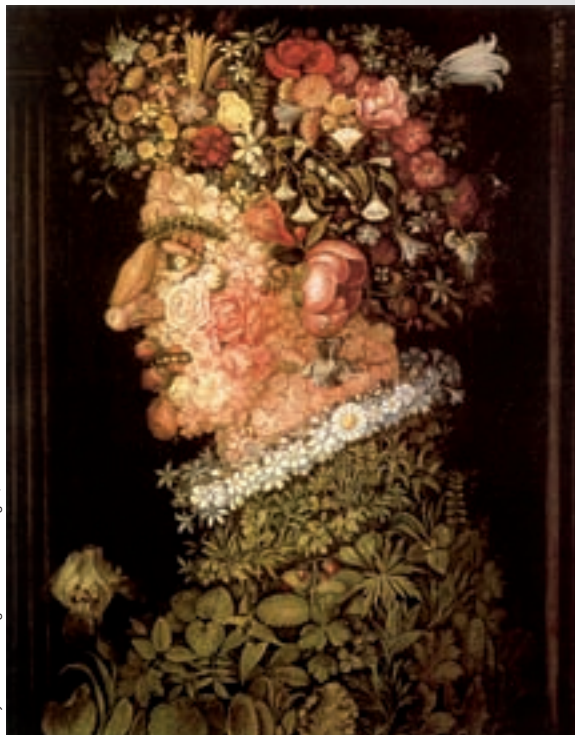
Giuseppe Arcimboldo. La primavera , sense data. Oli sobre fusta, 57 x 84 cm. En termes artístics, l'obra d'Arcimboldo podria comparar-se amb les tesis aristotelistes, divertides i enginyoses però del tot producte de la imaginació.

Si el llibre de Copèrnic va passar sense pena ni glòria, els de Galileu –potser a conseqüència de la seua capacitat retòrica– despertaven sempre apassionades controvèrsies, i «esclats d'emocions». Comptat i debatut, les tesis dels aristotelistes recordaven les creacions d'Arcimboldo, divertides i enginyoses, però extravagants i del tot producte de la imaginació. No hi havia comparació possible entre l'obra d'un pintor il·lustre (el seu amic Cigoli) i les extravagàncies del ingegnosissimo Arcimboldo. Una cosa és pintura, i l'altra és un divertiment, un acudit: Arcimboldo no ocuparà mai cap lloc en la història de la pintura, cap lloc preponderant s'entén. Els aristotelistes eren arcimboldians (falsos pintors), mentre que els que llegien l'idioma de la natura eren els vers pintors (els autèntics científics), els que tenien possibilitats d'accedir a la veritat, al perquè de les coses.