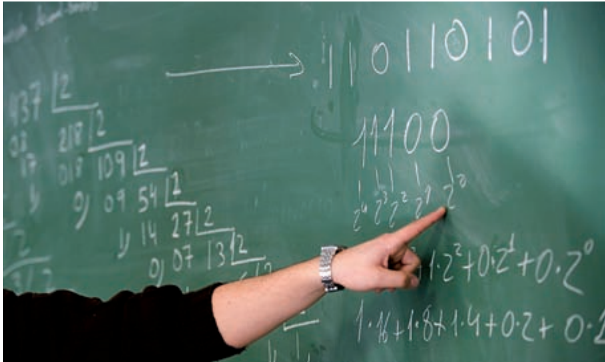
© Ana Ponce & Ivo Rovira