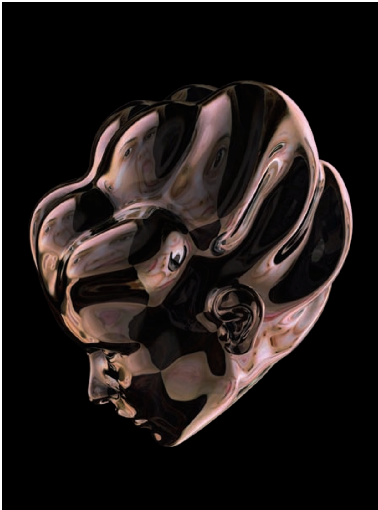
Marina Núñez. Imago (Inés) , 2009. Vídeo monocanal, 2 minuts. Produït per MUSAC, Lleó.