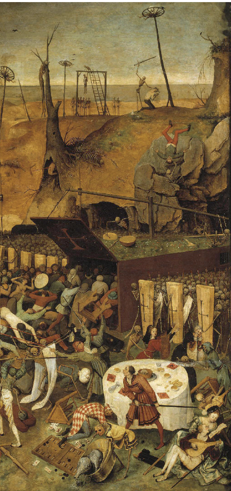
© Museu del Prado de Madrid

Durant els segles XIII i XIV, Xàtiva posseïa la segona juevia més important del regne, després de la de València. Sabem de la presència de metges jueus que hi exercien des del segle XIII. Samuel Abenmenassé, alfaquim de