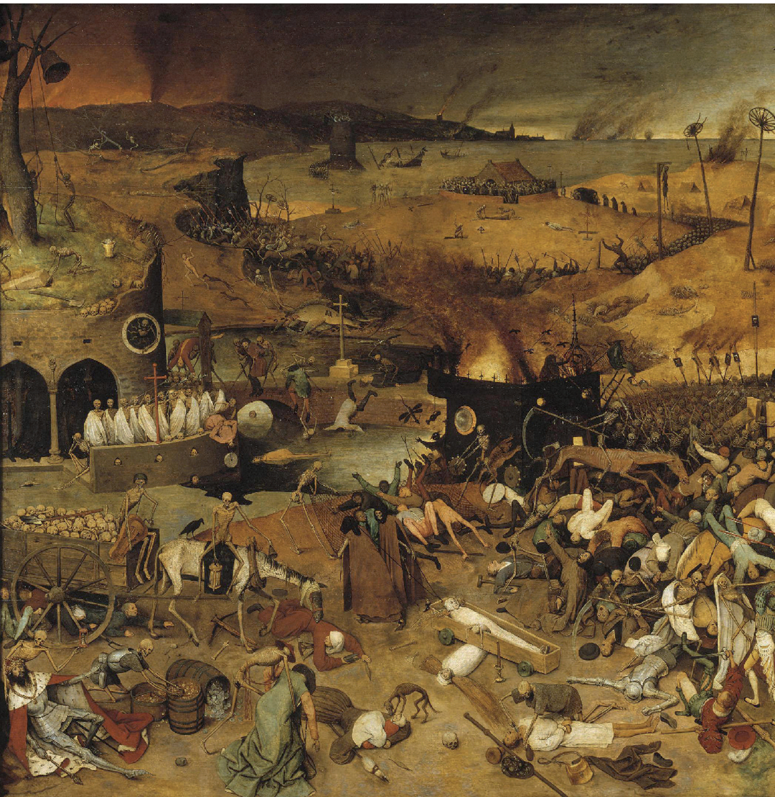
Pieter Bruegel «el vell». El triomf de la mort , c. 1562. Oli sobre taula, 162 x 117 cm.