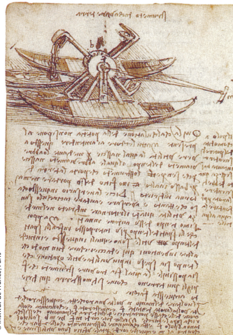
Els dibuixos de Leonardo da Vinci abracen una àmplia varietat de disciplines científiques, des de matemàtiques o arquitectura fins a botànica o anatomia humana. En les imatges, d'esquerra a dreta, manuscrit de Leonardo sobre musculatura (1509-1510), figura anatòmica que representa el cor, els pulmons i les artèries principals (1490-1500), i, per últim, un dibuix de una màquina per al drenatge de canals (1513-1514).