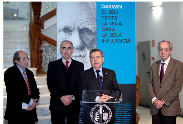
La Universitat ha celebrat nombrosos actes per tal de rendir tribut al naturalista anglès. Dalt, el rector assenyalava la importància de la fita històrica i científica durant la inauguració de l'exposició.