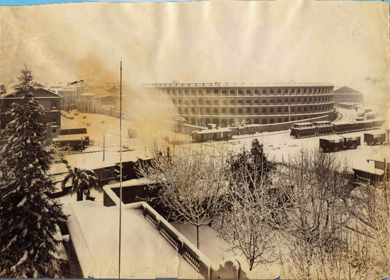
València, coberta per la neu al gener de 1885. La nevada va ser una de les més intenses del segle xix, ja que feia tant de fred que el mantell nival hi va aguantar uns quants dies sense fondre's.