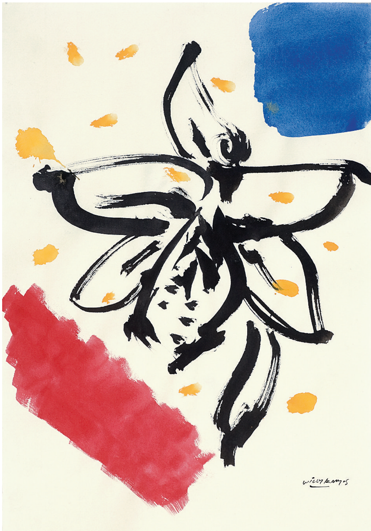
Willy Ramos. Orquídia 2 , 2008. Sèrie «L'evolució del color». Tinta xinesa i aquarel·la, 31,5 x 48,5 cm.