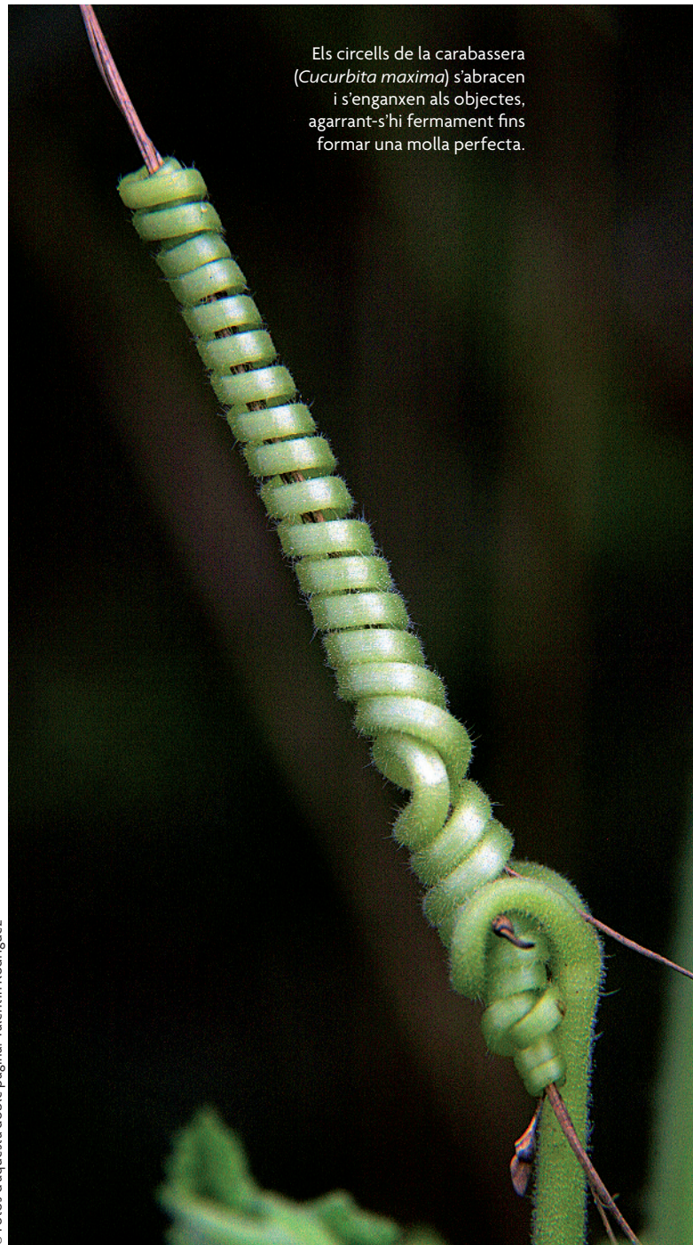
Els circells de la carabassera ( Cucurbita maxima ) s'abracen i s'enganxen als objectes, agarrant-s'hi fermament fins formar una molla perfecta.

Les estufes-hivernacle de plantes de la casa de Down de Darwin es van construir al començament de 1862. Durant els tres anys següents, quan tenia una salut delicada, Darwin va ser capaç d'observar moviments de nutació en les plantes enfiladisses, tant en les mencionades estufes com al seu estudi. Va publicar les seues troballes el 1865 –tan sols sis anys després de la publicació de L'origen de les espècies – sota el títol «The Movements and Habits of Climbing Plants» en el Journal of the Proceedings of the Linnean Society of London , vol. 9, pàgines 1-128, incloent-hi tretze gravats en el text. Aquest treball ofereix una visió meravellosa de Darwin com a experimentador que realitza observacions sobre molt diverses espècies vegetals, que para especial atenció a no modificar allò que s'ha observat mitjançant els mètodes d'observació i que realitza mesures acurades. En un moment donat, Darwin descriu