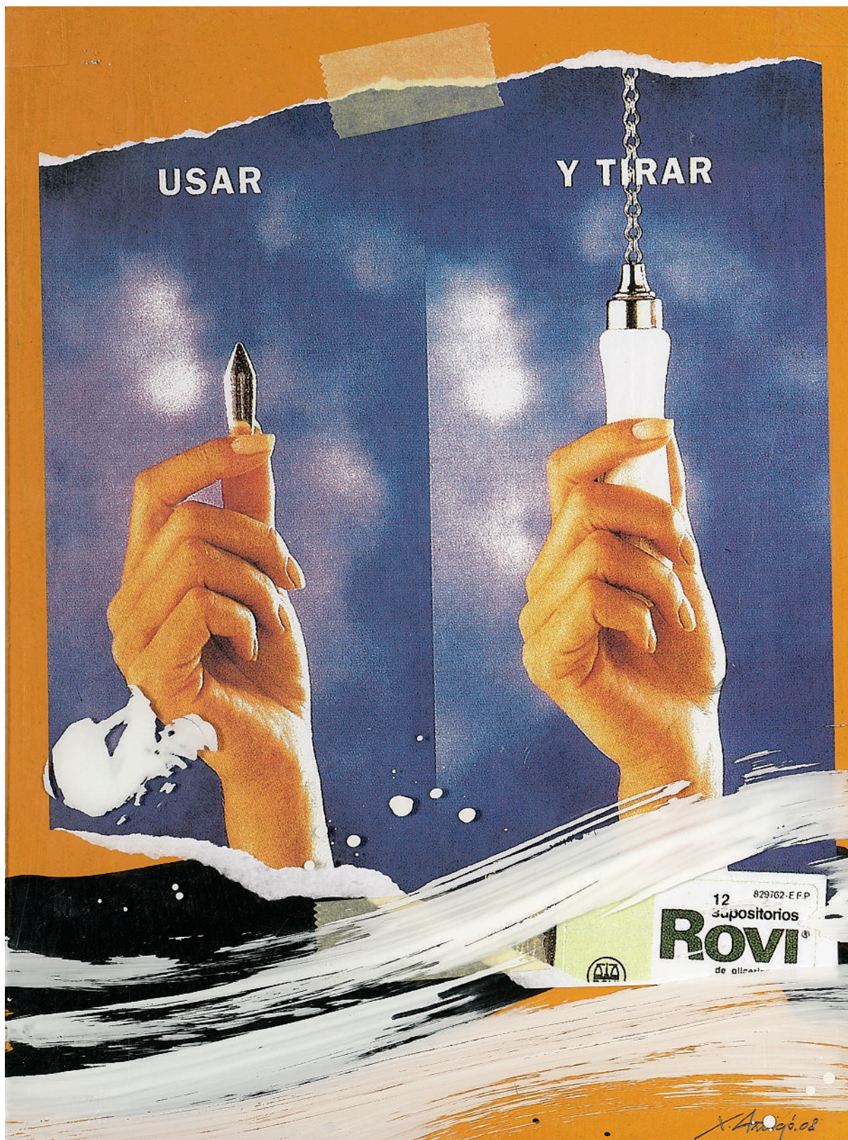
Ximo Amigó. Usar i tirar , 2008. Tècnica mixta, 31 x 42 cm.