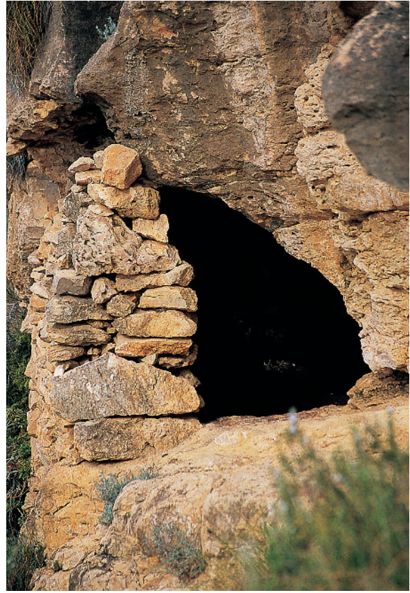
A les pesqueres o a la vora dels camins, els pescadors construïen refugis aprofitant algun buit o balma natural. A l'esquerra, la cova del Ti Domingo l'Abiar i, a la dreta, la cova Morro del Bou.

culats a la terra, que, amb l'aprofitament eventual dels recursos del mar, complementaven la dieta familiar, el menjar per a un o més dies, o bé incrementaven amb la venda del peix els mesquins ingressos provinents de l'agricultura. A més de l'autoconsum o de la venda, en comunitats de disponibilitat monetària reduïda era habitual baratar-lo per altres mercaderies o aliments. L'aridesa d'aquestes terres sempre assedegades, empo-bridades periòdicament per les cíclics sequeres, gravitava sobre els més desfavorits en el repartiment social i empentava els seus fills a l'aventura i incertesa de les pesqueres. El llaurador, esdevingut pescador, feia mitja jornada de treball al camp el dia que «baixava a la pesquera». Aquest binomi forçat llaurador/pescador, amb unes característiques úniques, exemplifica la lluita per la supervivència de les classes més desfavorides en les societats rurals, antany sempre necessitades de complementar els recursos amb què subvenir l'urgent dia a dia.