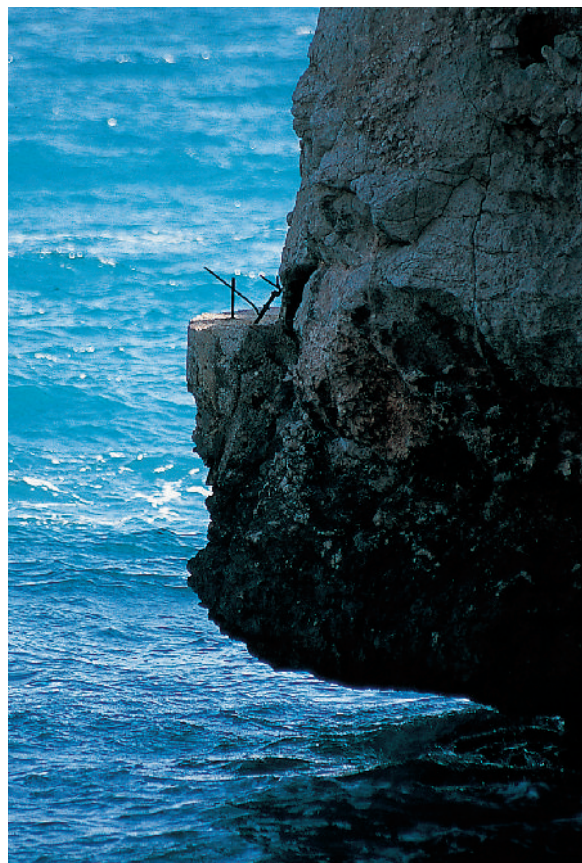
Detall de la imatge de la pàgina anterior amb la pesquera existent a la cova dels Arcs. El pescador passava tota la nit en aquest relleix de difícil accés i amb mobilitat limitada.

«DESPENJANT-SE AMB CORDES PER LES PARETS ROCOSES, VENCENT EL VERTIGEN DELS TALLATS MARINS, ARRIBAVEN A PRECARIS RELLEIXOS EN PRIMERA LÍNIA SOBRE EL MAR, PER A PESCAR DES D'ALLÍ DURANT LA NIT»