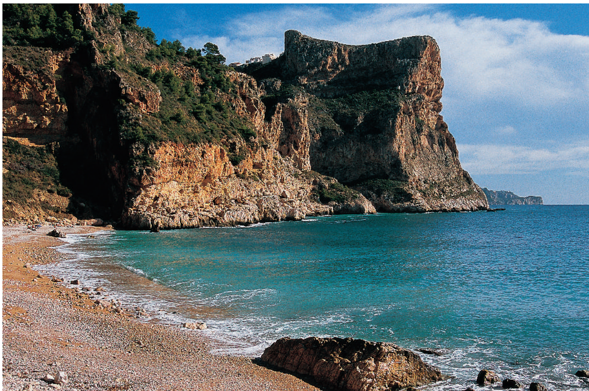
Cala del Moraig. Prop d'ací s'inicia el recorregut pel camí dels penya-segats que arriba fins a la cala Llebeig.

xe. Un panell informa sobre la senda i descriu els seus valors naturals i etnològics. Des del panell, cal seguir carretera amunt i als 110 o 120 metres, a l'esquerra, hi ha un indicador amb fletxes orientatives i marques.