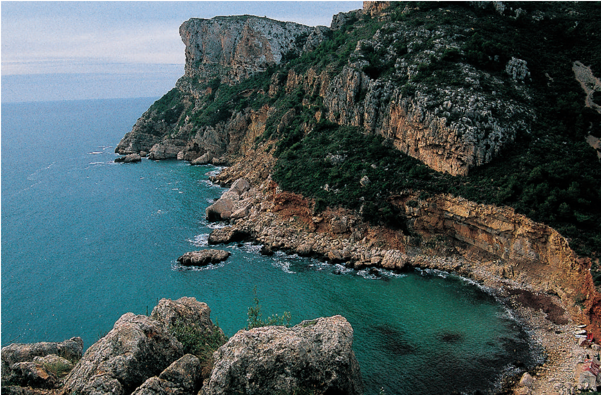
Cala Llebeig, amb la punta de Moraira al fons.

unit a l'erosió marina, és responsable de gran nombre de cavitats submergides i d'incidències en la morfologia dels penya-segats. A pocs metres cap al sud de la cova dels Arcs, un riu subterrani d'aigua dolça aboca el seu important cabal al mar per un curs submergit, del qual s'han explorat 2.000 metres, un bell i excepcional fenomen, paradigma de la intensitat dels processos càrstics de gran magnitud, generalitzats a les Marines. En l'exploració d'aquest riu silenciós, sumit en la foscor eterna, tres espeleòlegs subaquàtics han perdut la vida, atrapats al laberint de galeries totalment submergides.