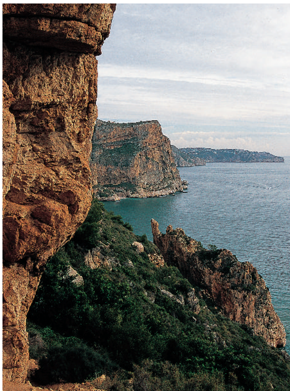
Balcó de les pesqueres al camí dels penya-segats. Tot i que conèixer de prop les pesqueres requereix material i habilitat d'alpinista, aquesta ruta permet recórrer en altura el medi natural de les pesqueres de Benitatxell.