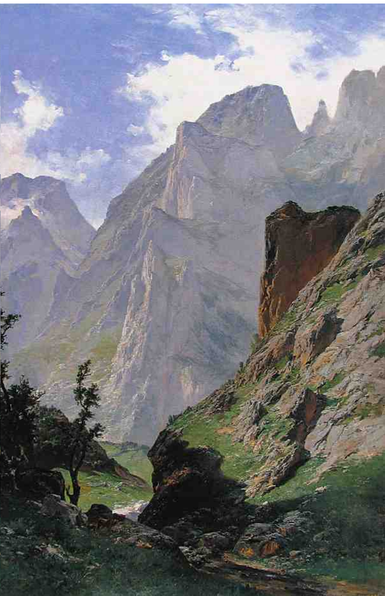
Carlos de Haes. Canal de Mancorbo en los Picos de Europa , 1876. Oli sobre llenç, 123 x 168 cm.

«L'ASCÈTICA SOLEDAT DE LES MUNTANYES, QUE TANT VA COLPIR FRIEDRICH, HA ESTAT PROU EVITADA PELS NOSTRES PINTORS. BEN MIRAT, NO HI HA HAGUT UNA SOLA SERRA, UN SOL CIM, UN SOL PUJOL, UN SOL PUNT GEODÈSIC QUE HAJA ESPERONAT SERIOSAMENT ELS APEL·LES VALENCIANS»