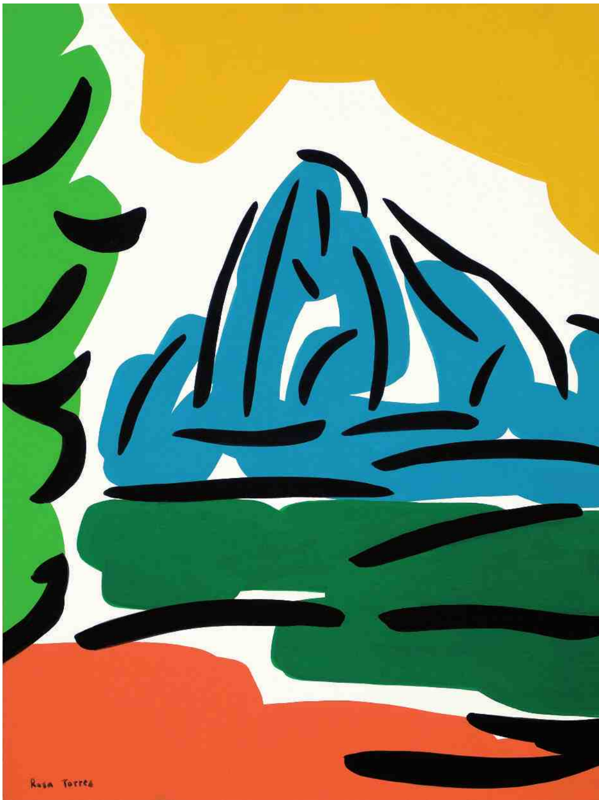
Rosa Torres. Puigcampana , 2008. Acrílic sobre cartró, 50 x 70 cm.