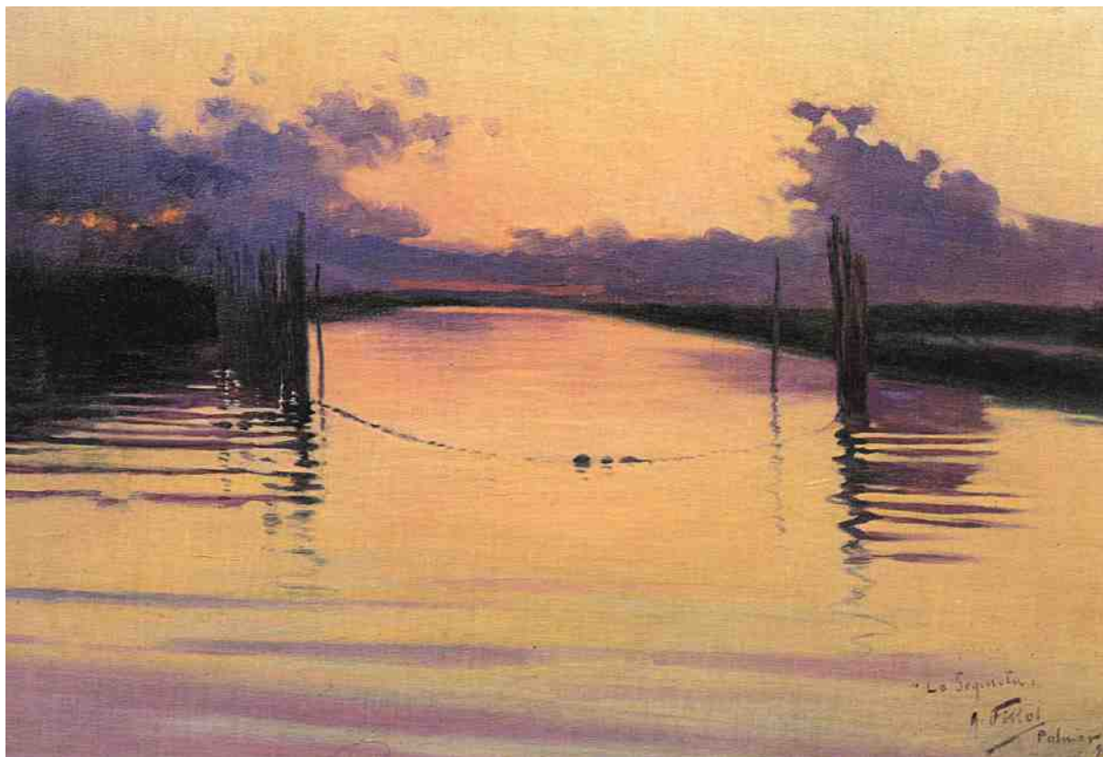
Antoni Fillol Granell. La sequieta , 1909. Oli sobre llenç.