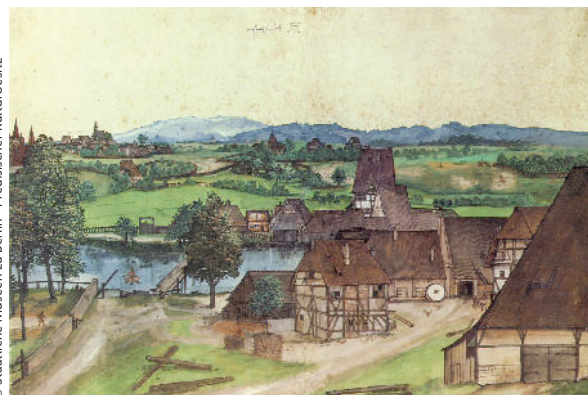
© Staatliche Museen zu Berlin - Preußischer Kulturbesitz

Albert Dürer. Molí , 1489. Aquarel·la, 42,6 x 28,6 cm. A partir de l'Edat Moderna el paisatge es converteix en una cosa digna de ser pintada per ella mateixa, pel valor estètic i pel plaer que comporta observar-lo. En aquesta obra, Dürer realitza una interpretació idíl·lica de l'escena, per donar amplitud a la vista i destacar els aspectes més rellevants del paisatge.