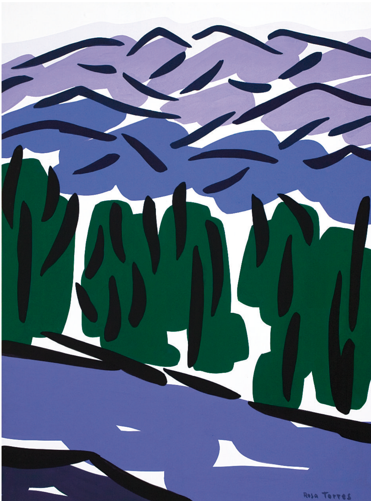
Rosa Torres. Canigó , 2008. Acrílic sobre cartró, 50 x 70 cm.