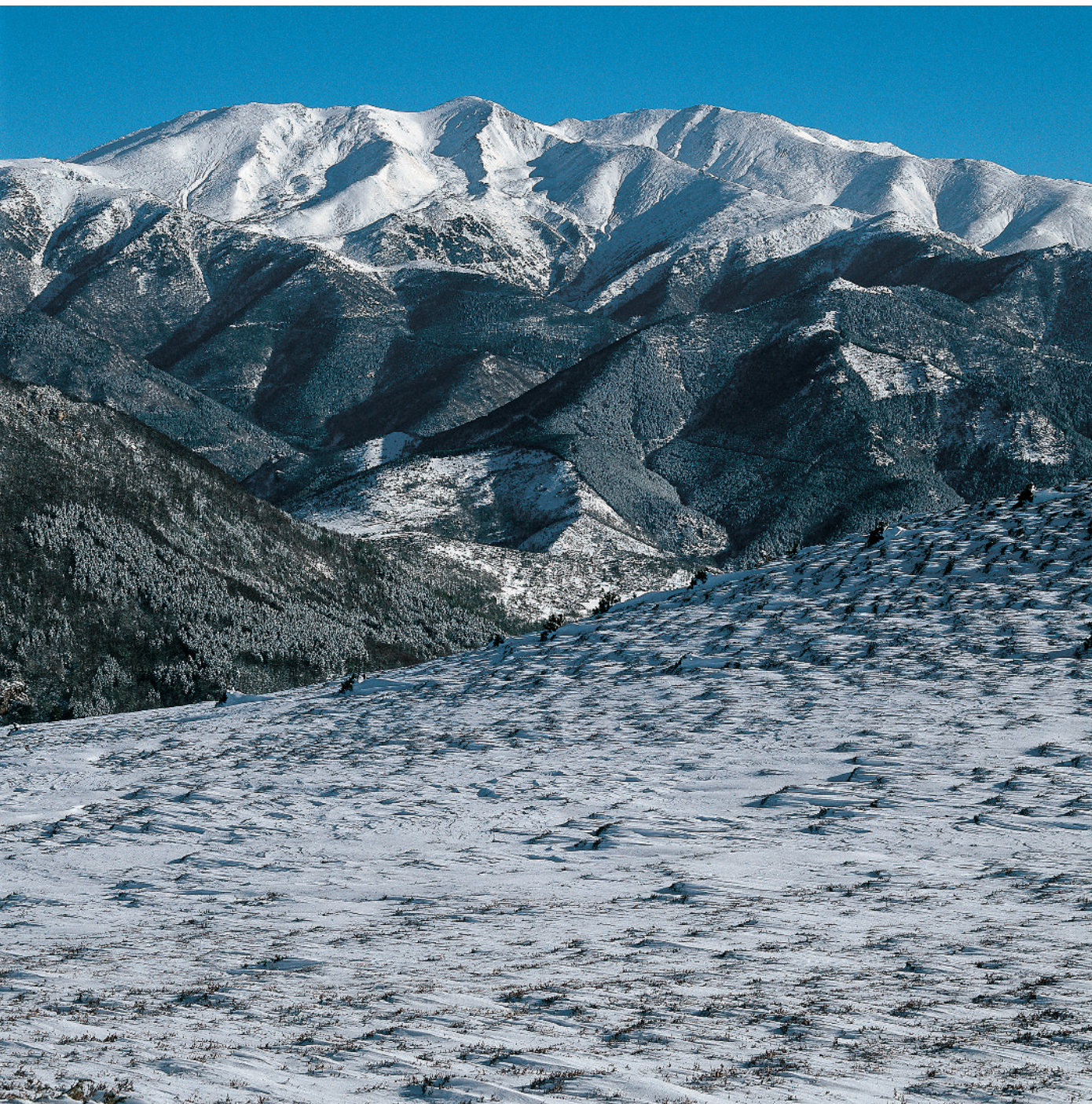
En la imatge, el massís del Canigó, als Pirineus orientals.