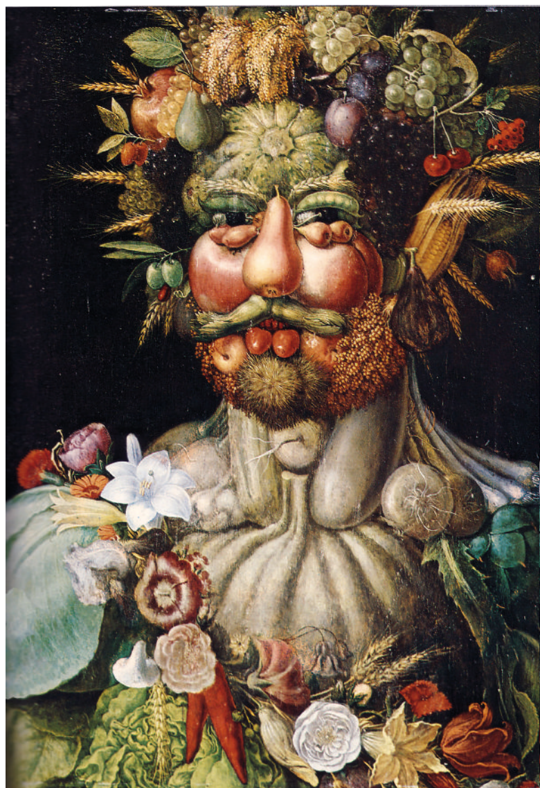
Percebre el tot no significa percebre les parts ja que tot paisatge implica una unitat visual. L'obra d'Arcimboldo representa un rostre humà elaborat a partir de flors i fruits; aïllats són fruits, però combinats conformen el retrat de l'emperador Rodolf II d'Habsburg. A dalt, Giuseppe Arcimboldo. Vertumnus , 1590-1591. Oli sobre fusta, 56 x 68 cm.