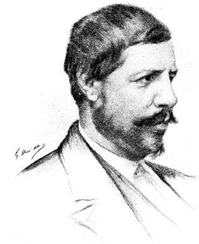
Retrat de l'arxiduc Lluís Salvador d'Àustria realitzat per Gaston Vuillier

L'arxiduc Lluís Salvador d'Àustria va arribar a les Balears el 1867, quan just tenia vint anys. Enamorat de Mallorca per l'encant de la seva costa nord, hi va viure pràcticament la resta de la seva vida. Va retratar fidelment les Balears a la seva obra magna Die Balearen in Wort und Bild Geschildert («Les Balears descrites per la paraula i la imatge») estructurada en nou volums: sis dedicats a Mallorca, dos a Menorca i un a les Pitiüses. L'autor va dedicar gran part de la seva vida a l'elaboració d'aquesta obra monumental, que recull informació detallada sobre les illes Balears en camps tan diversos com l'antropologia, la geografia, l'art, l'etnologia, el folklore, les ciències naturals o la literatura. Tota la informació està il·lustrada amb gravats elaborats a partir d'apunts del mateix arxiduc, o de fotografies, amb la finalitat de reproduir fidelment la realitat de les Balears de finals del segle XIX, cosa que els confereix un valor do-