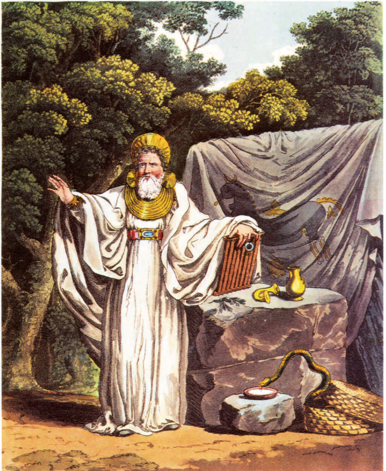
Druida romàntic amb vestuari d'inspiració arqueològica segons S. R. Meyrick i C. H. Smith en The costume of the original inhabitants of the British Isles de 1815.