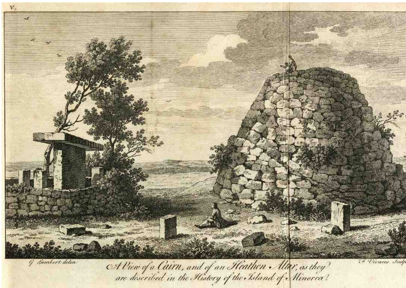
Primera representació d'un conjunt talaiòtic menorquí en una làmina publicada per J. Armstrong en The history of the island of Minorca , en la segona edició de Londres el 1756. Aquest és un dels primers tractats sobre l'illa, òrfena fins aleshores de bibliografia específica.

D'altra banda, la presència de súbdits britànics, sobretot militars d'elevada i avançada formació, féu que quan la seva atenció intel·lectual es va girar envers l'illa produïssin obres innovadores que, a més, en ser d'edició anglesa assoliren notable difusió internacional, afavorida per l'atenció que Menorca mereixia en el context polític de la Mediterrània. Per això mateix la història de John Armstrong, publicada a Londres el 1752 i reeditada el 1756, fou traduïda a l'alemany el 1754, al francès el 1769 i a l'espanyol el 1781. Les nocions que havia recollit en l'ambient britànic sobre megalitisme i druidisme el portaren a incloure-hi els monuments talaiòtics