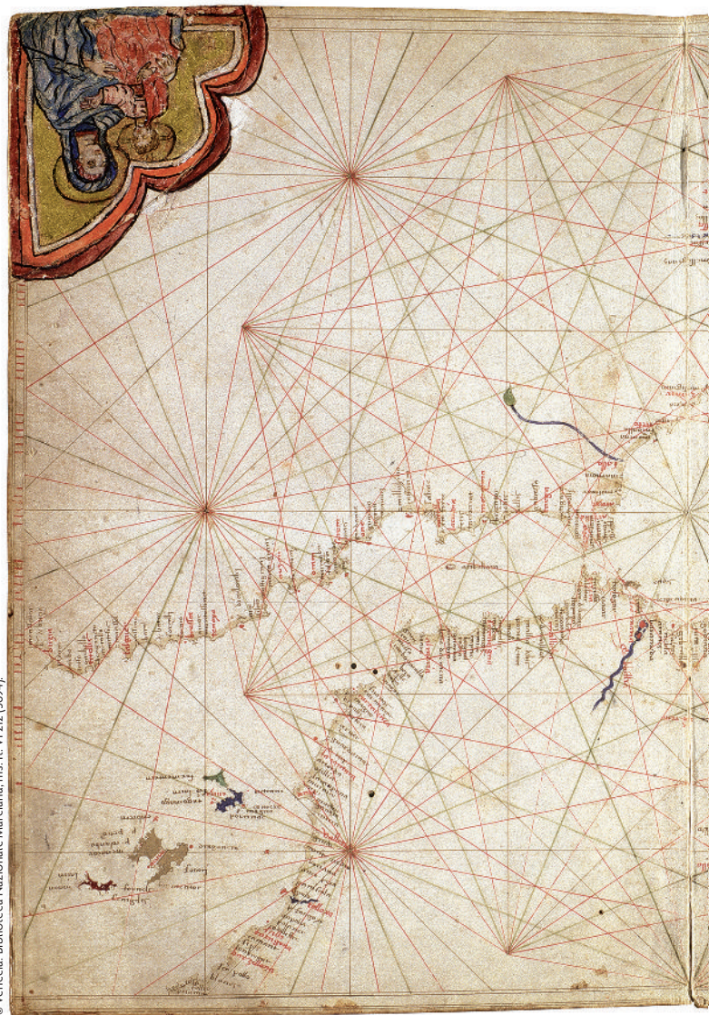
Atlas portolà de Giacomo Ziroldi o Giroldi, 1426. Es tracta d'un doble full (27 x 37 cm) que conté la península Ibèrica, les illes Balears i Pitiüses, el Magrib i les Canàries. Els atlas, a partir de P. Vesconte, són un producte típicament venecià. L'autor d'aquest atlas –el més prolífic– era oficial de combois navals de la Sereníssima República. Exemplar molt sobri quant a decoració: els sants de les cantoneres són sobreafegits i d'una altra mà.

Totes les cartes portolanes duen escales gràfiques en milles, cosa que implica un afany d'exactesa i utilitat: els mariners o mercaders podien planificar els seus viatges i els patrons o pilots preveure les seves singladures. És clar que els usuaris de les cartes havien de ser lletrats. Les portolanes naixen, sens dubte, en un ambient de comerciants alfabetitzats i que ja usen habitualment la numeració àrab per als seus comptes. L'escriptura en vulgar facilita determinats aspectes del progrés tècnic, encara que bona part de l'estil de les cartes provingui de la rúbrica, dels calendaris i dels manuscrits de les escoles eclesiàstiques. Fins i tot entre els primers mapistes hi trobem alguns clergues, com Carignano o Pareto.