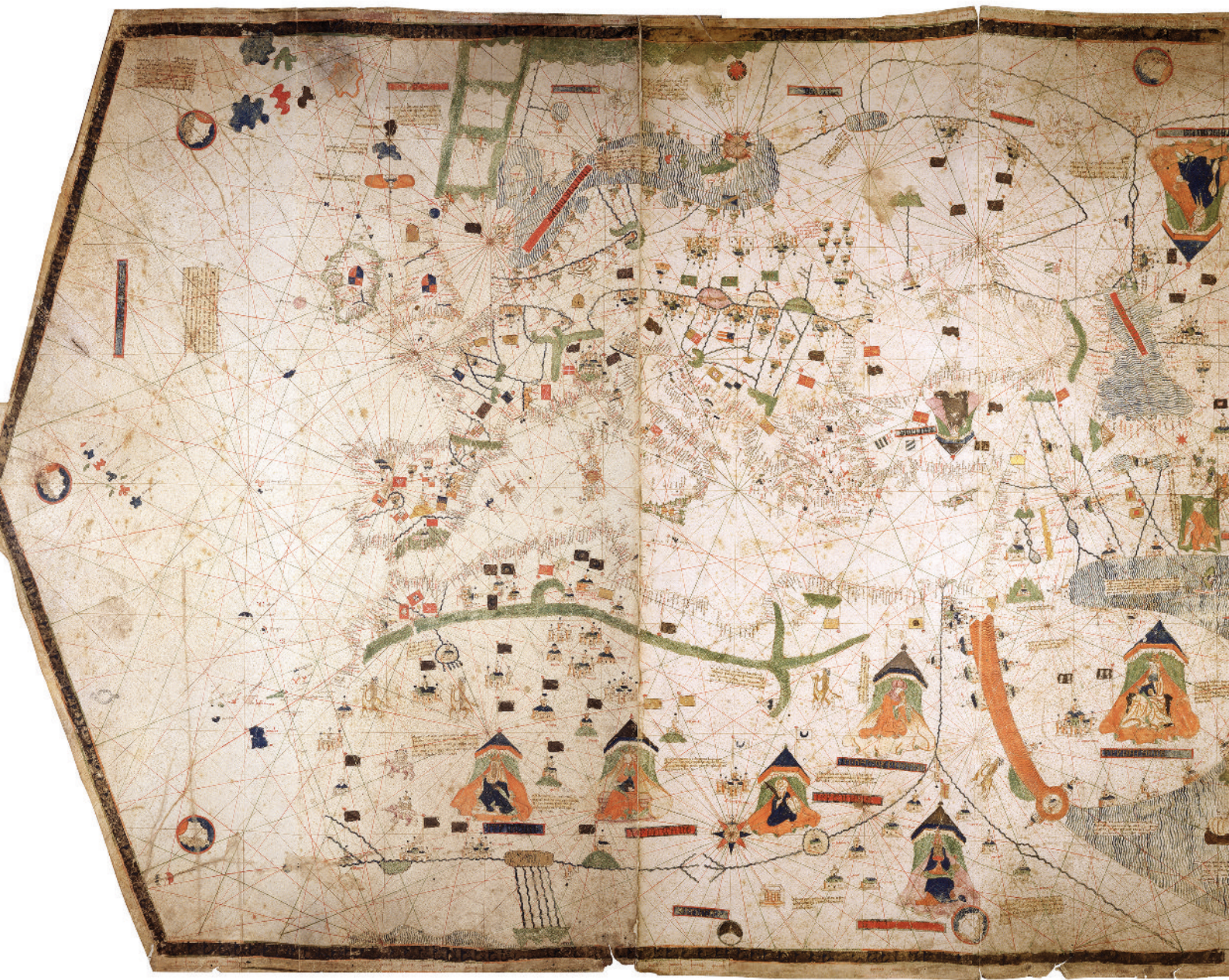
Carta anònima mallorquina de l'obrador de G. de Vallseca, 1440 ca. Obra de luxe amb decoració profusa i llegendes abundants. L'escola de Cresques Abraham s'hi pot endevinar fàcilment, si ens fixem en els sobirans africans i europeus i en les seues tendes o en els àngels bufadors de la majoria dels vuit vents. Noteu les mars interiors de blau arrissat, la tramuntana ja convertida en rosa dels vents i les vinyetes de Barcelona i València.