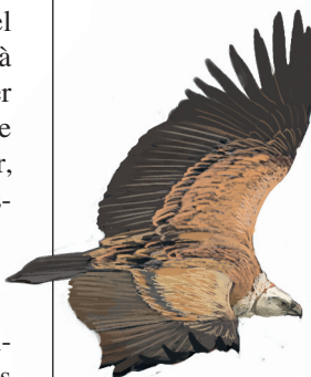
Il·lustració: Antoni Llobet

«EN EL TRENCACLOSQUES DE LA CONSERVACIÓ DE LA DIVERSITAT BIOLÒGICA A EUROPA ELS HUMANS TENIM UN PAPER RELLEVANT COM A PART INTEGRANT DE MOLTS SISTEMES NATURALS»