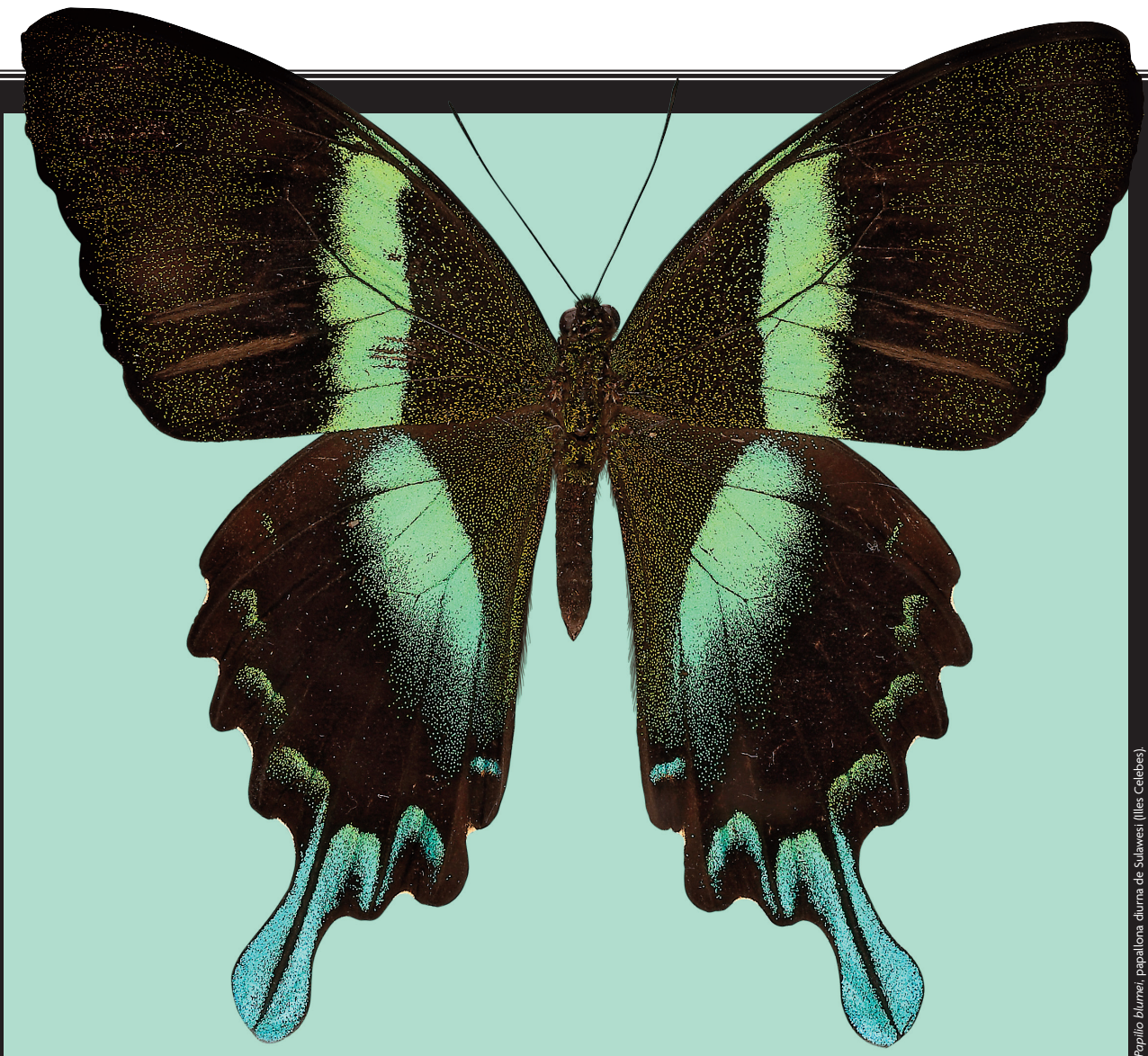
Papilio blumei, papallona diurna de Sulawesi (Iles Celebes).

Per fotografiar aquesta papallona amb gran qualitat d'imatge es va disposar perpendicularment perquè així no fes falta gaire profunditat de camp i es pogués seleccionar un diafragma mitjà ( f/8 ), que proporciona el màxim poder de resolució: 80 línies/mm.