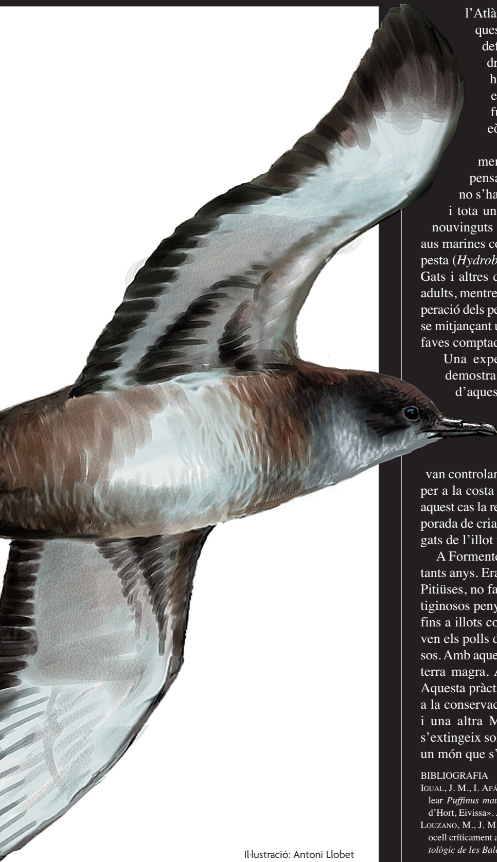
Il·lustració: Antoni Llobet

l'Atlàntic, però mentre està enfeinat amb les tasques de cria, les zones d'alimentació estan ben definides en punts de la Mediterrània que caldria protegir de les activitats humanes que han dut l'espècie fins a aquest punt i estudiar els impactes que hi podrien tenir actuacions futures com ara la instal·lació de camps eòlics marins.