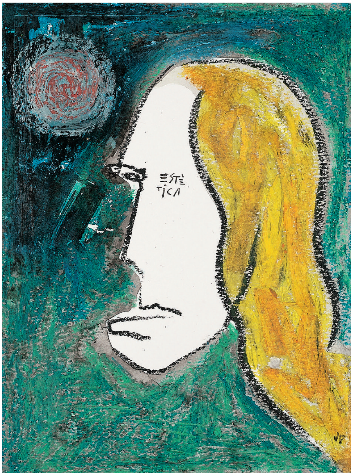
Joan Pijoan. Estètica , 2007. Cera i aquarel·la sobre paper, 24 x 32 cm.