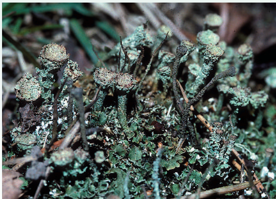
Cladonia pixidata , líquen del mateix gènere que el nostre protagonista, que destaca pels apotecis en forma de trompeta. També el podem trobar a casa nostra.