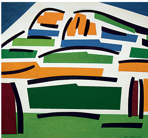
Rosa Torres. Penyagolosa , 2004. Oli sobre llenç, 130x110 cm.

de parc precipitada i amb una manca absoluta de consens amb la població afectada. El decret de declaració passa per damunt d'algunes qüestions que haurien d'haver estat el moll del procés: que Penyagolosa és una terra habitada, que el pic de Penyagolosa –tal i com passa en la major part del massís– està dins de diverses finques particulars i que, a pesar d'això, els valencians el tenim com a nostre sense necessitar ser-ne els propietaris. També obvia una qüestió que constitueix, a hores d'ara, la major feblesa del Parc: l'extensió. El Parc, tal i com s'ha declarat, és un parc de butxaca, reduït a les finques públiques propietat de la Generalitat amb l'afegit de les finques privades estrictament necessàries per a comprendre el pic. Han quedat fora del parc quasi tots els espais de major valor ecològic i paisatgístic del massís, en un desfici que revela la incoherència del propòsit protector. Si els responsables polítics de la declaració hagueren pres el seu temps per a aconseguir un consens amb la població afectada, probablement el resultat hauria estat més coherent.