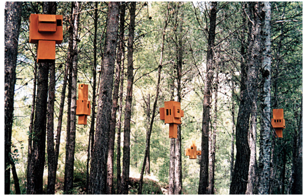
Refugios lumínicos, 2007.

La seua forma particular de treball en llocs específics (dalt dels arbres i roques, en rius) requereix un esforç físic particular), en què es diferencia de la pràctica escultòrica convencional?