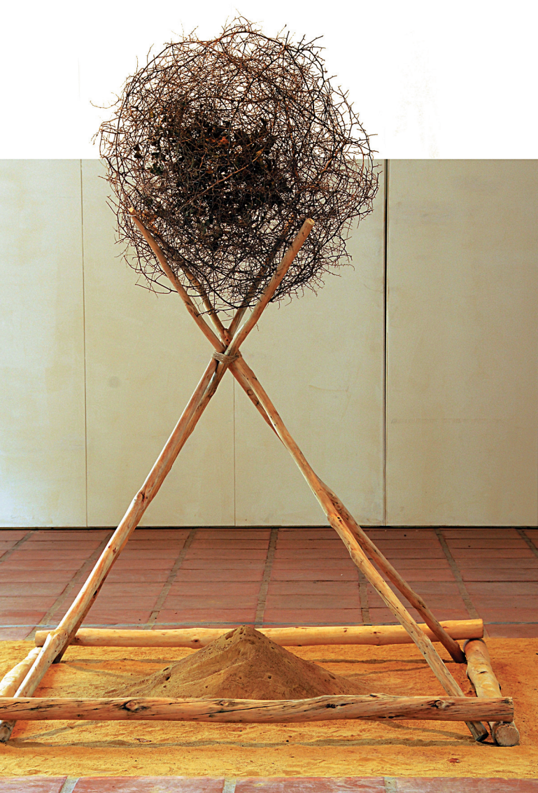
Polen, corazón y vida, 2007.

migues que anaven i venien com a persones per la gran via; està documentat en el vídeo Para las hormigas . Com ja sabem, l'equilibri ecològic podria entrar en crisi si faltaren les formigues o altres insectes, però no estaria en crisi si faltàrem els humans.