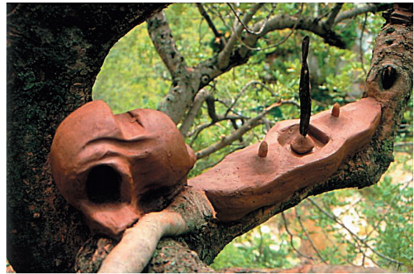
La morada del guardián, 2007.

«SI UN ESPECTADOR PASSARA DAVANT D'ALGUNA DE LES MEUES OBRES EN LA NATURALESA SALVATGE ÉS POSSIBLE QUE NO LA VERA»