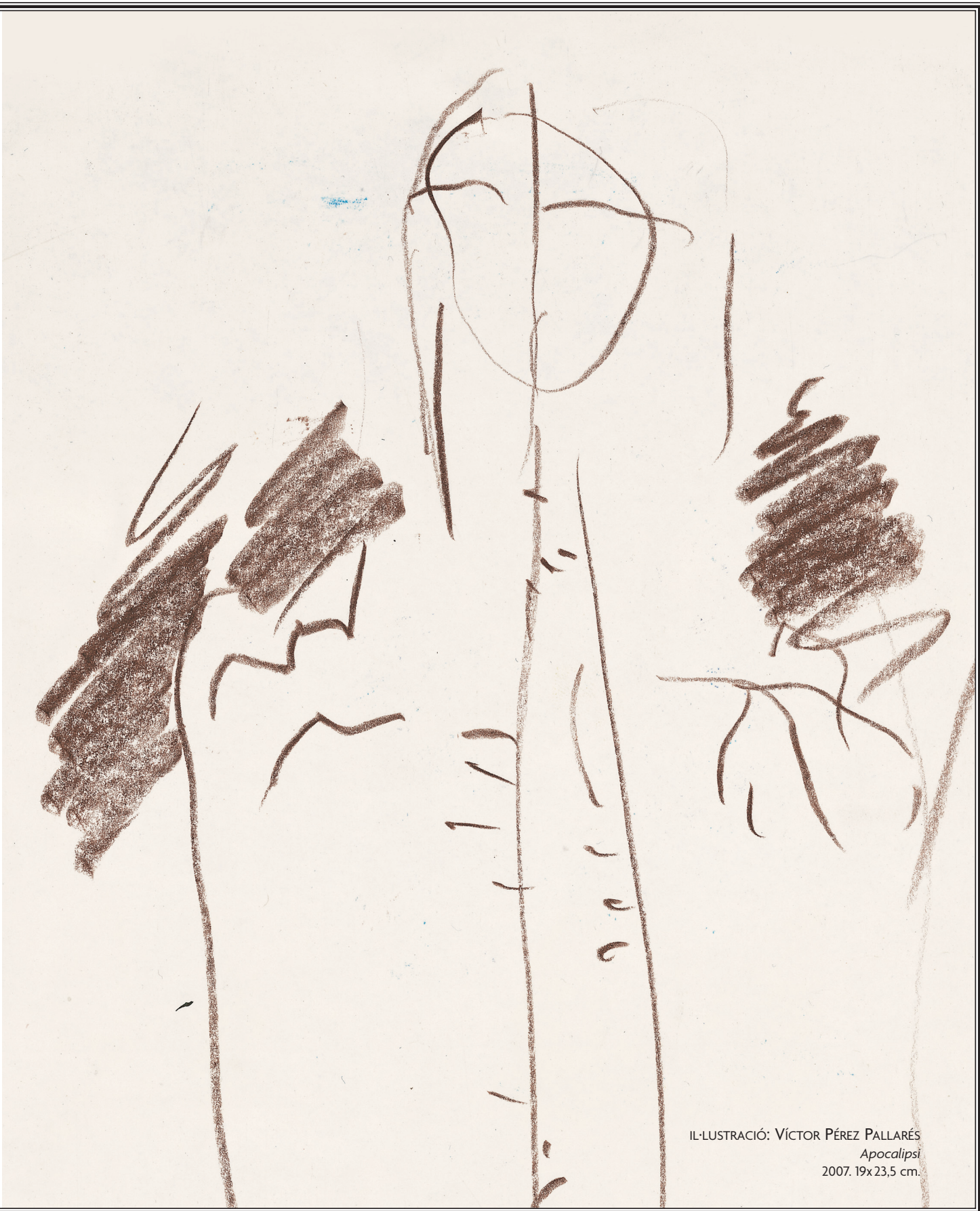
IL·LUSTRACIÓ: VÍCTOR PÉREZ PALLARÉS Apocalipsi 2007. 19x23,5 cm.