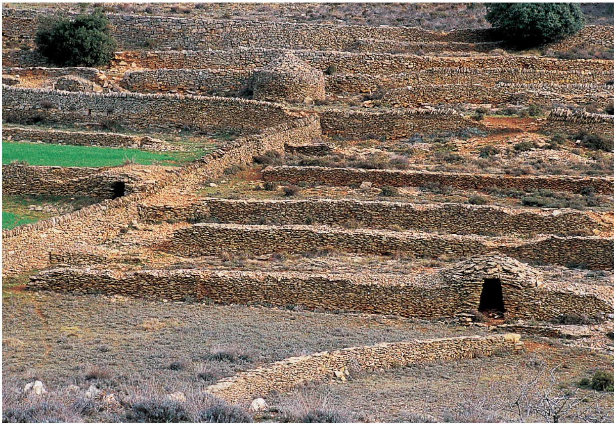
Vilafranca (Alt Maestrat) ofereix un paisatge amb multiplicitat de construccions de pedra en sec. L'Ajuntament ha comptabilitzat aproximadament mil cabanyes de pedra distribuïdes per tot el terme municipal.

d'aquesta indústria popular són els bancals, les plataformes artificials de cultiu amb què els llauradors valencians van guanyar terres en l'angoixosa demanda d'aliments conseqüència de l'espectacular increment demogràfic del segle XVIII.