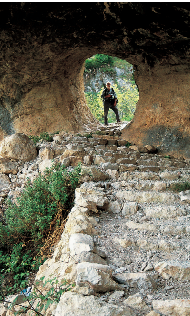
El camí de les Jovades, a la Vall de Laguar (Marina Alta), disposa de trams com els de la imatge, construïts amb pedra seca.

«L'ABANDÓ D'AQUESTS PAISATGES IMPRODUCTIUS A MERCÈ DE L'ACCIÓ DEVASTADORA DEL TEMPS ÉS EL PRINCIPI DE LA FI D'UNA OBRA INGENT, TENIM L'OBLIGACIÓ CULTURAL DE PRESERVAR AQUESTS ESPAIS REPRESENTATIUS DE L'HOME I LA TERRA»