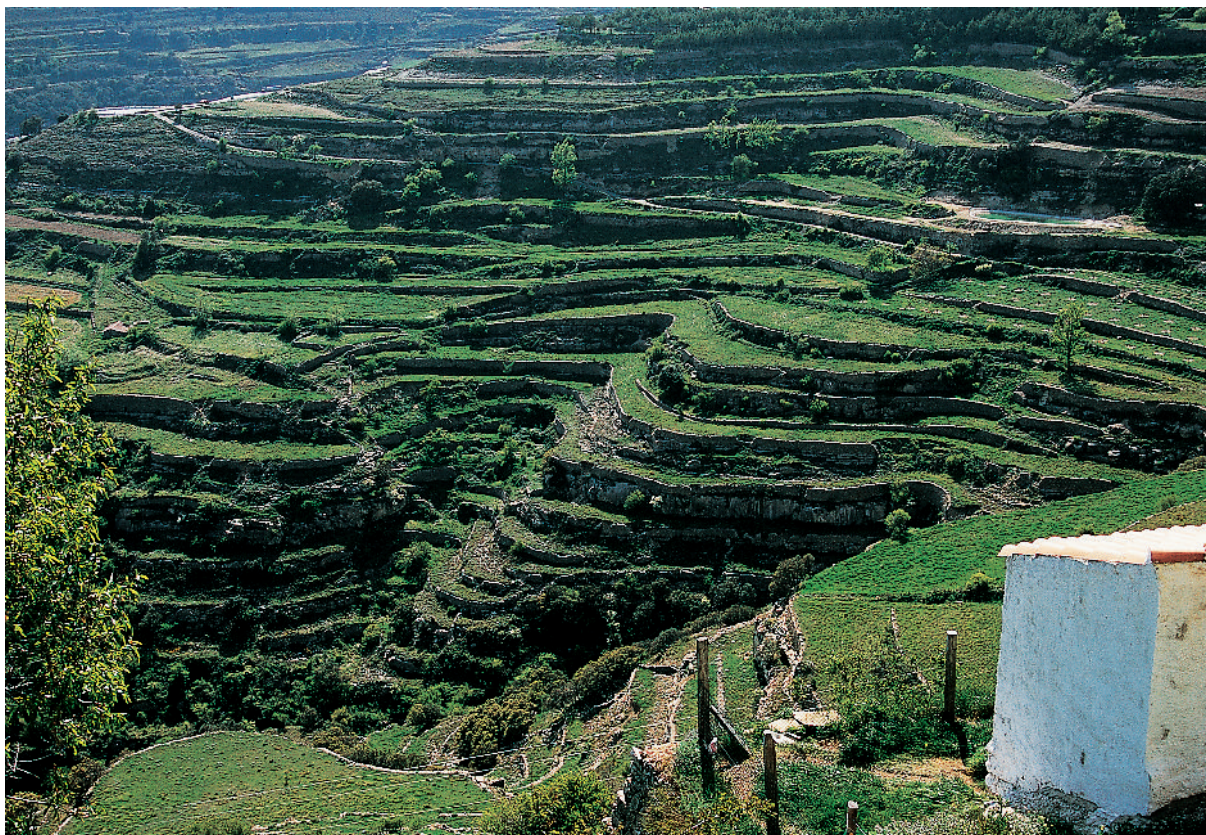
L'abancament per organitzar la parcel·lació agrícola es va desenvolupar sobretot a les terres de secà. A la imatge es pot observar l'estructura irregular i en terrasses que configuren els bancals a Ares del Maestrat (Alt Maestrat).

tori productiu immens, on les construccions en pedra, al llarg de centenars de quilòmetres de bancals i altres elements, configuren el paisatge « roban á la naturaleza inculta eriales, convirtiéndolos en campos útiles: suben hasta lo mas alto de los montes para reducirlos á cultivo », ens diu Cavanilles, testimoni d'excepció (pròleg de les Observaciones ).