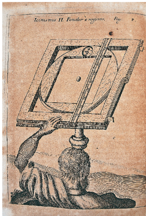
© Biblioteca Històrica UV, Y-6-28, iconismus II, p. 5

«EL MÈRIT DEL FELIPÓ ÉS EL D'HAYER IMBUÏT ALS “NOVATORES” UN CERT ESPERIT GEOGRÀFIC. LES MATEMÀTIQUES D'ALESHORES ENGLOBAVEN MOLTS ASPECTES DEL CONEIXEMENT CIENTÍFIC I TÈCNIC»