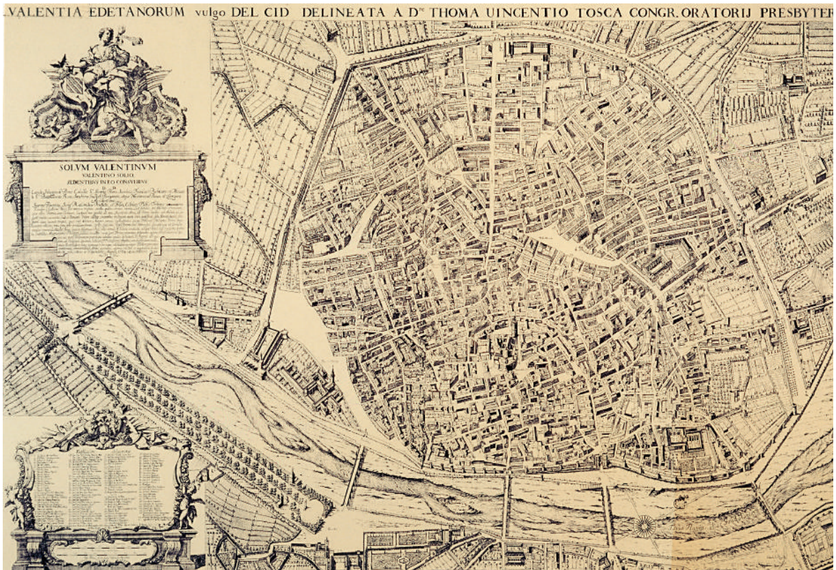
El plànol de València gravat i imprès, reducció i actualització del manuscrit de T. V. Tosca, realitzada per J. Fortea sota la inspiració d'A. Bordazar. La data del gravat (1738 ca) es dedueix de la presència d'edificis alçats entre 1704 i 1738 (93 x 140 cm).

de Teixeira (1656). El món dels il·lustrats valencians era prou receptiu i la perspectiva entrava en les preocupacions dels novatores , accentuada per l'arquitectura militar, com reflecteix el volum V del Compendio , d'acord amb la bibliografia jesuítica.