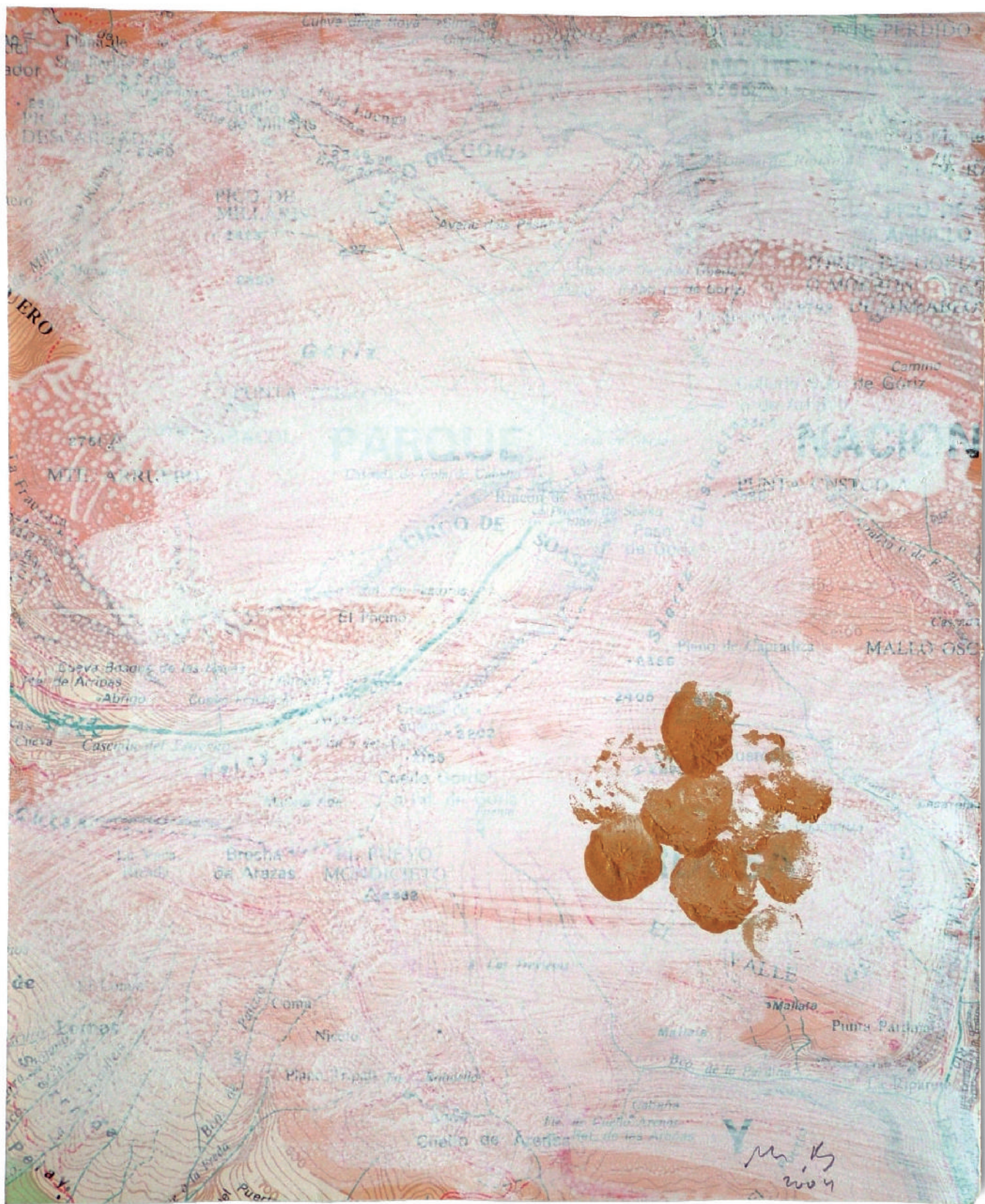
Manuel Bellver. Els fruits de la contemplació (sèrie de 6 dibuixos), 2004. Aiguada i pintura d'or sobre paper imprès en òfset. 21,4x17,5 cm.