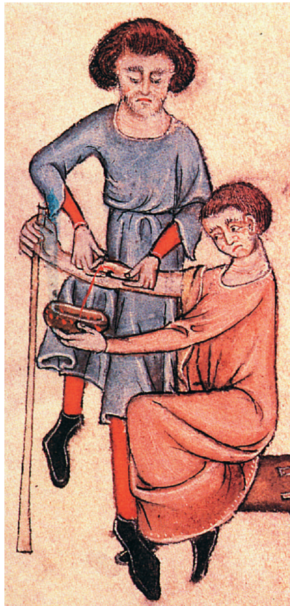
Un barber-cirurgià practica una flebotomia o sagnia terapèutica a un pacient ( Saltiri de Lutrell , c. 1340. British Library, ms. Add. 42130, f. 61r)

Un dels tòpics historiogràfics més habituals ha estat el de la figura del jueu usurer. En bona mesura, l'increment dels coneixements sobre els hebreus medievals ha fet que se'n difongués una imatge més completa, de la qual emergeix el jueu metge. Ara bé, ni tots els jueus foren prestadors ni tampoc metges, si bé és quasi impossible trobar a la Corona d'Aragó una