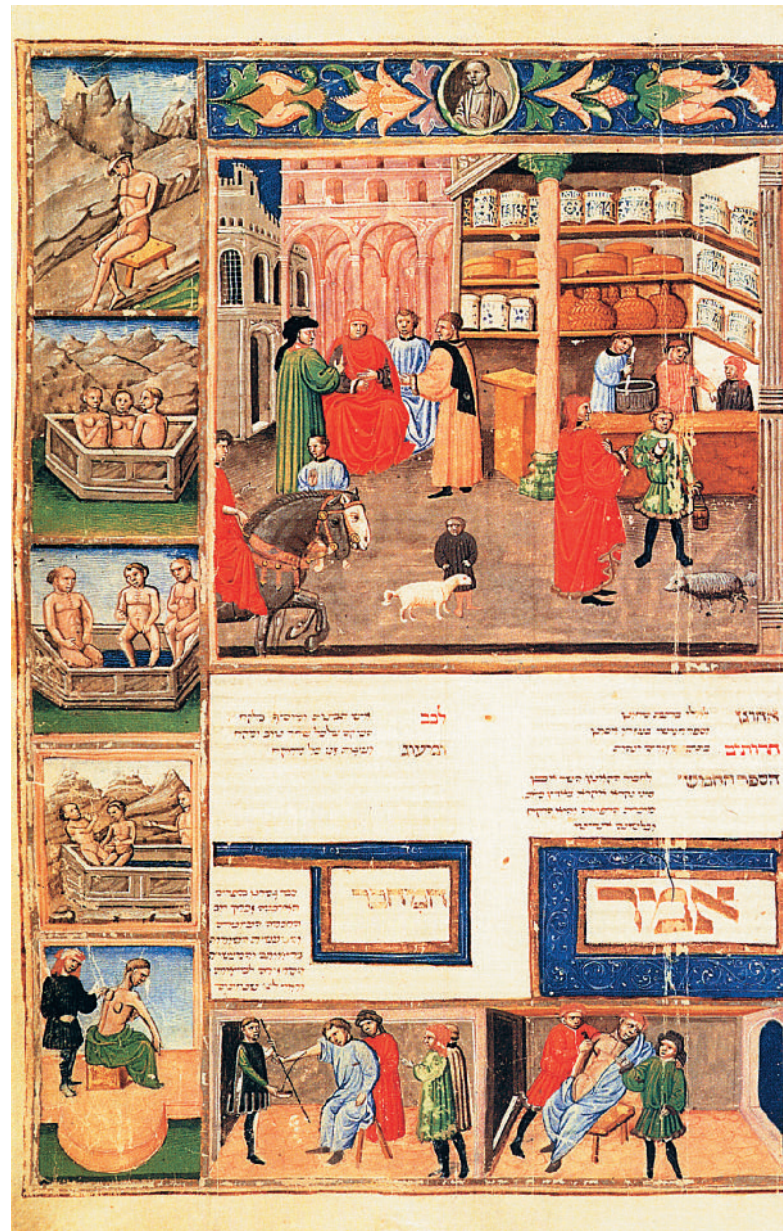
Obrador d'apotecari obert al carrer en una ciutat medieval. Al voltant es poden apreciar diverses escenes de tractaments mèdics (manuscrit hebreu del Canon d'Avicenna, copiat a Itàlia a finals del segle xv. Bolonya, Biblioteca Universitària, ms. 2197, f. 492r)

«ELS APOTECARIS FABRICAVEN MEDICAMENTS ATENENT A LES RECEPTES EMESES PELS FÍSICS, TOT I QUE LA GAMMA D'ACTIVITATS DE CARÀCTER ARTESANAL I MERCANTIL QUE PODIEN DESENVOLUPAR ERA AMPLÍSSIMA»