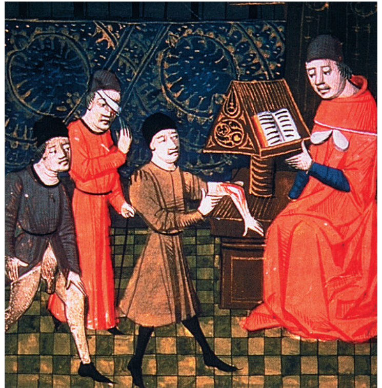
En la seua condició de mestre, com es pot apreciar pels seus atributs acadèmics, Guy de Chauliac rep en consulta alguns pacients. Es poden apreciar diferents tipus de consultes que havien de solucionar regularment els cirurgians medievals ( La Grande Chirurgie de Guy de Chauliac, segle XIV. Bibliothèque Nationale, París, ms. Français 396, f. 366r.).