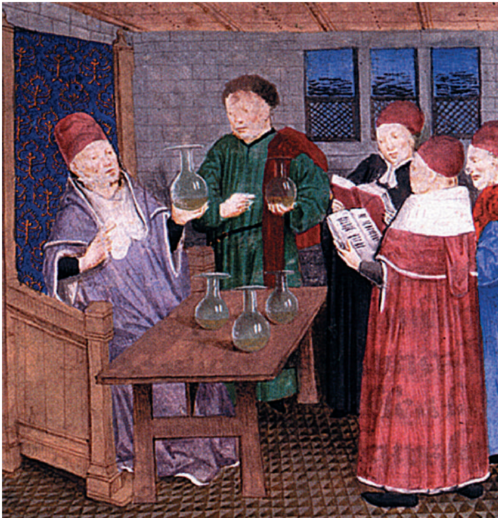
L'examen de l'orina constituí una de les principals eines de diagnòstic i pronòstic a l'abast dels practicants de la medicina ( Des Proprietez des Choses , traducció del tractat de l'enciclopèdia mèdica de Bartholomeus Anglicus, segle xv. British Library, Cottonian Ms. Augustus AVI, f. 66r.).