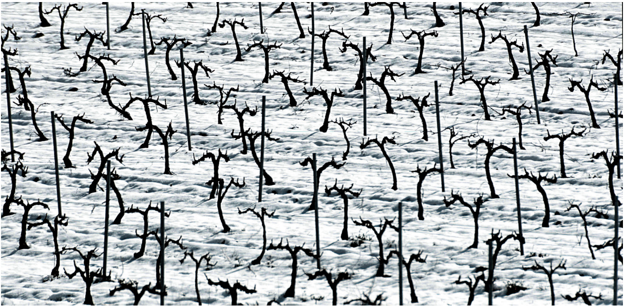
En aquesta pàgina podem veure algunes de les fotografies de Miquel Francés a l'exposició.