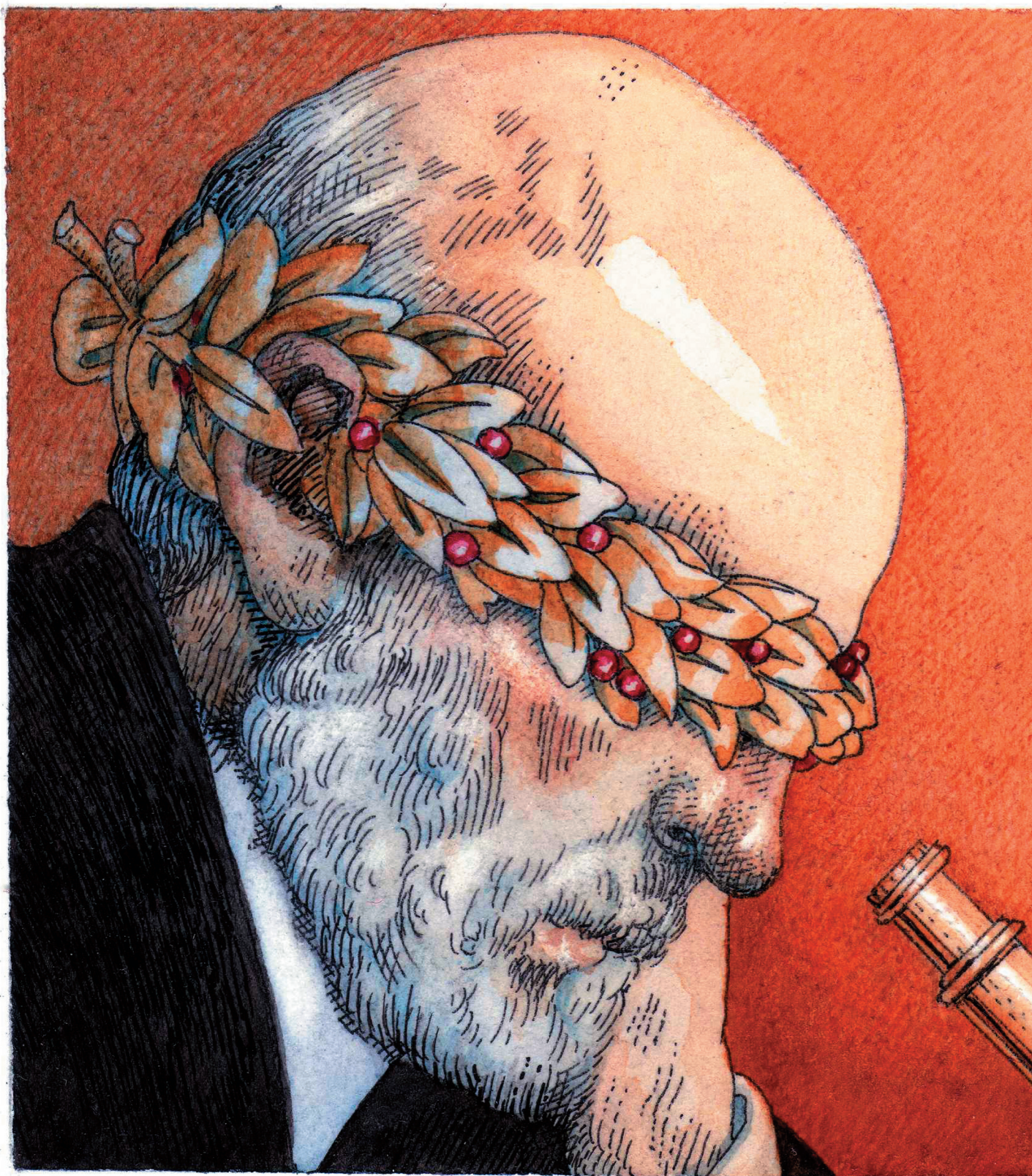
Il·lustracions d'aquesta pàgina i de la següent de Manuel Boix, Cajal , 2006. Aquarel·la.