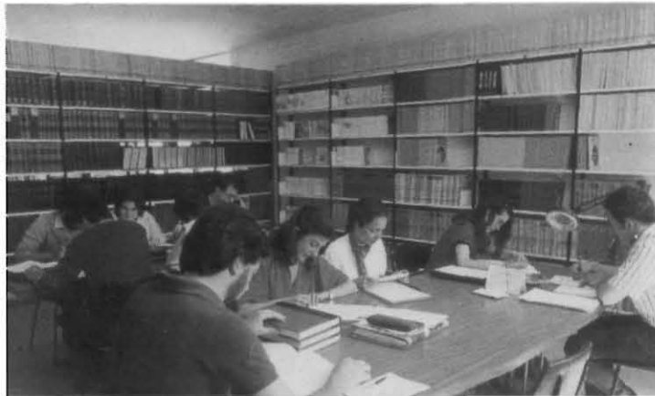
Les biblioteques universitàries han passat de ser llocs de treball a llocs d'acollida o d'estudi

Els sis centres de documentació que existeixen a la Universitat de València, comparteixen els problemes assenyalats per a les biblioteques, però en aquest cas minimitzats, per tractar-se d'un tipus d'ens l'especialització dels quals fa que, entre els seus usuaris, constitueixen àmplia majoria els investigadors. Aquesta característica i el reduït de les seues sales de consulta elimina la possibilitat que esdevinguen meres sales d'estudi. Altra característica que comparteixen quatre d'aquests sis centres de documentació és el fet que siguen producte d'iniciatives personals o institucionals de diferents facultats o departaments. Un centre pioner en la documentació mèdica, com ara el Centre de Documentació i Informàtica Biomèdica , naix lligat a la tasca dels catedràtics José María López Piñero i M a Luz Terrada, i actualment forma part de l'Institut