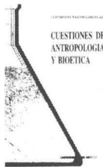
(EDITADO POR PASTOR GARCÍA) CUESTIONES DE ANTROPOLOGIA Y BIOETICA

PASTOR GARCÍA, Luis Miguel (ed.), Cuestiones de antropología y bioética, Universidad de Murcia, 1993, 144 pp.