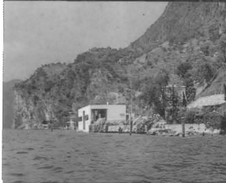
Habitatge unifamiliar a la vora del llac Iseo, Vello di Marone, Itàlia. Grassi / Gavazzeni 1962.

" En arquitectura només existeix un model: la casa. El carrer, l'edifici públic, la plaça, etc., reponen a la mateixa finalitat. S'han de fer com es fa una casa"