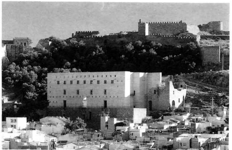
Vista del Teatre Romà de Sagunt, després de la seua restauració i rehabilitació.

Però els veritables mestres no te'ls pots llevar del davant, són més aviat ells els que t'utilitzen. Francesco de Giorgio és, per exemple, una de les figures que més m'interessen. És un arquitecte del qual quasi no se'n sap res, ni es pot afirmar amb seguretat quines són les seues obres. La majoria li són només atribuïdes. I m'interessa perquè ve a ser un símbol del que jo preconitze: que l'arquitectura no respon a la voluntat personalista de l'arquitecte, sinó que és l'expressió d'una línia de pensament més general i comuna, més social, diguem-ho així.