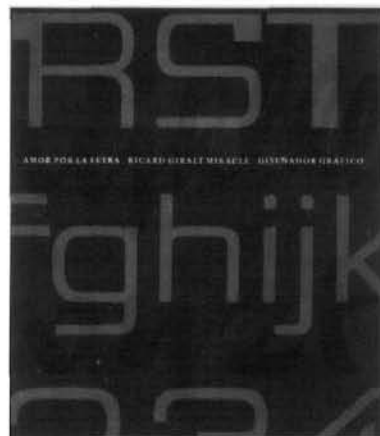
Portada del llibre Amor por la letra, de Ricard Giralt Miracle, un dels autors d'ineludible referència per als estudiosos del disseny de les lletres.

ELS AUTORS VOLEN ENDREÇAR AQUEST DOSSIER A LA MEMÒRIA DE RICARD GIRALT MIRACLE I LA SEUA OBRA. AMB ADMIRACIÓ I RESPECTE.