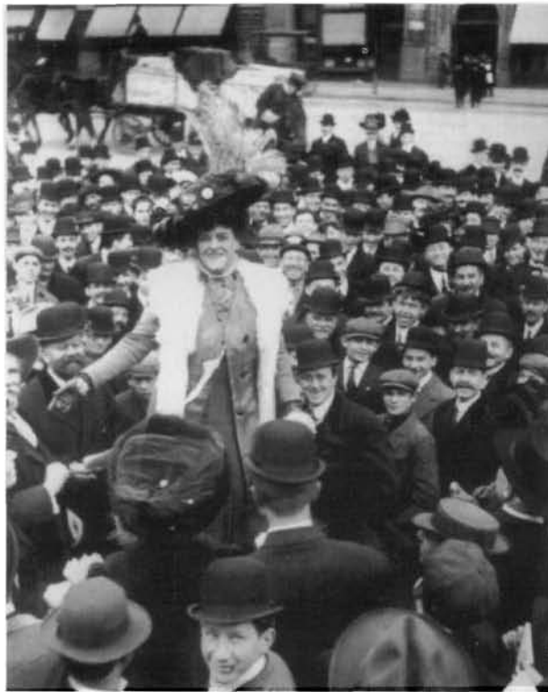
Sufragista adreçant-se a una audiència masculina. Ca. 1900

Així doncs, es pot constatar ja en aquest resum que la complexitat de la polèmica teòrica dins del feminisme és àmplia. Per això mateix proposaria com una qüestió teòrica central dilucidar si la dispersió dels discursos feministes és desitjable en les investigacions i en la pràctica política i quins plantejaments no dogmàtics ni de raó total es poden arribar a desenvolupar. Caldria debatre si és necessari mantenir les propostes dels diferents feminismes com a propostes antitètiques o si es busquen elements de confluència entre ells. Encara que la qüestió és complexa, proposaria com a element mediador entre els discursos feministes les nocions de crítica i de llibertat.