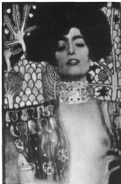
Gustav Klimt, Judith , 1901

«La teoria feminista introdueix i produeix un acostament epistemològic als problemes generals de múltiples disciplines, canviant així les seues perspectives»