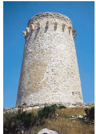
Dalt, a l'esquerra, torre del cap de Moraira (Teulada, Marina Septentrional) el 1989, abans de la restauració. A la dreta, torre del cap de Moraira el 1992, després de la restauració.