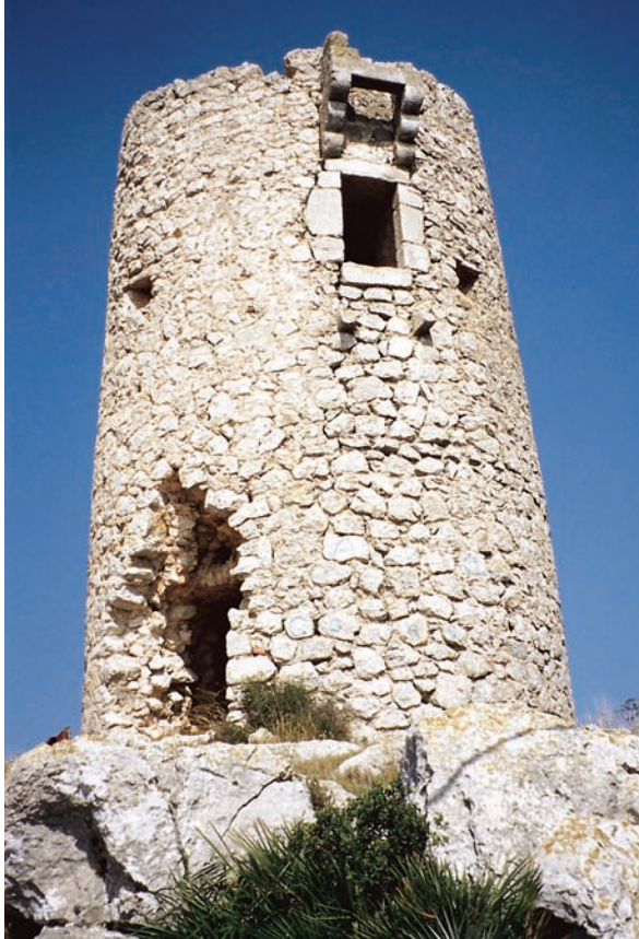
Dalt, torre Alta o de Sant Benet (Alcalà de Xivert, Baix Maestrat), situada a uns 500 metres sobre el nivell de la mar.

Dalt, a la dreta, des de la torre de Sant Benet, veiem una porció del litoral que encara estem a temps de protegir: la serra d'Irta. Fet i fet, continua fidel a la seua funció, guaitar la mar i la terra immediata.