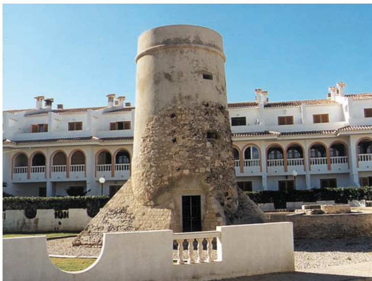
Torre de l'Almadrava o del Palmar (Dénia, la Marina Septentrional): maig de 1992. Defensava l'aiguada del riu Girona i protegia l'almadrava que hi havia ben a prop, amb el temps, propietat del marquès de Dénia. Davall, torre de l'Almadrava (Dénia, la Marina Septentrional): novembre de 2000. Si algú pensa que la destrucció del litoral és cosa del passat, aquesta és la prova del seu error. Reconstruïda de forma discutible, la torre resta avui isolada del context històric i geogràfic, del paisatge que li donava raó de ser. N'és un exemple d'una concepció reduccionista del patrimoni valencià.

formaven sovint els límits entre zones. El baix Segura i el Vinalopó eren partits separats pel riu Segura. Del terme d'Alacant fins a la penya d'Ifac s'estenia un tercer partit, deixant tota la Marina Septentrional –el quart partit–, com un subsistema tancat, coherent amb les condicions geogràfiques de la comarca. Tota la llenca de les planures litorals, entre la fita del terme de Dénia i la de Castelló (de la Safor fins a la Plana), restava dividida en quatre zones i Oliva, l'Albufera de València i el Grau de Sagunt n'eren límits interns. De la serra del Desert de les Palmes fins a Sòl de Riu s'estenia l'últim partit, unitari, “protegit” pel Prat de Ca-